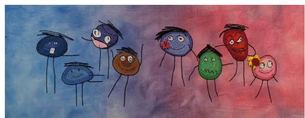
Rajah 6: Karya "Ayah and Mama"