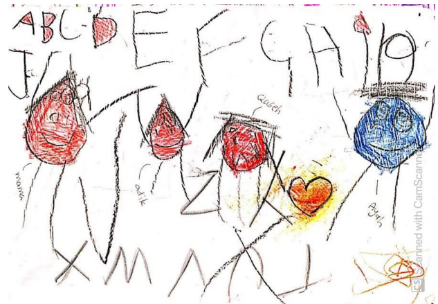
Rajah 3: Keluarga

bermain bersama adik dan saudara. Terdapat juga imej lain yang ditonjolkan seperti imej permainan iaitu robot. Imej robot dilakar besar kerana permainan tersebut merupakan permainan kegemarannya ketika itu. Manakala imej saudara merupakan imaginasi serta hayalan kanak-kanak di dalam lakaran bagi menyatakan perasaan rindu terhadap saudaranya kerana lama tidak bertemu akibat PKP. Setiap imej yang ditonjolkan mampu menunjukkan emosi yang berbeza-beza. Lakaran dihasilkan penuh pada permukaan kertas bagi menceritakan segala aktiviti harian yang berlaku dalam rumah.