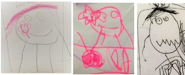
Rajah 5: Lakaran imej ibu

Bapa merupakan insan penting dalam sesebuah keluarga. Bagi seorang kanak-kanak perempuan, bapa dianggap hero keluarga dan perlindungan mereka. Lukisan ini menonjolkan tiga imej bapa dalam situasi yang berbeza-beza. Lakaran yang bersahaja dengan penggunaan warna biru menjadi keutamaan dalam menggambarkan imej bapa. Ekspresi wajah dan emosi juga ditonjolkan bagi menggambarkan keadaan, situasi dan emosi bapa sewaktu dilihat seperti gembira, marah dan sebagainya.