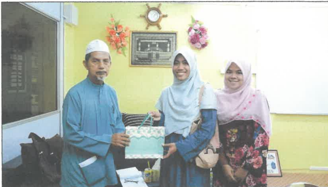
Gambar 2: Penemubual menyampaikan cenderahati kepada tokoh