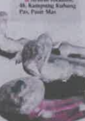
Gambar 3: Keratan surat khabar Utusan Malaysia, 13 Februari 2011

HARI Kraf Kebangsaan 2011 23 Februari - 7 Mac 10 pagi - 10 malam Kompleks Kraf Kuala Lumpur Jalan Conlay www.krafangan.gov.my