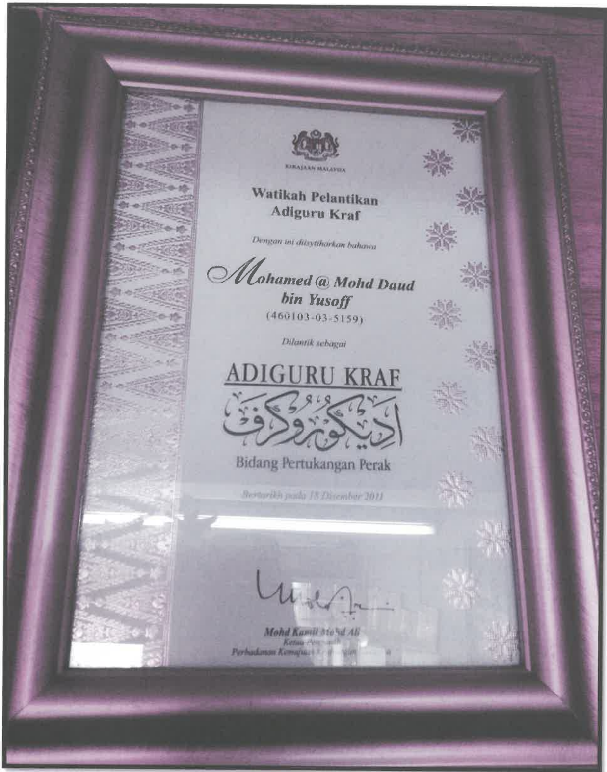
Gambar 2: Watikah perlantikan Adiguru Kraf