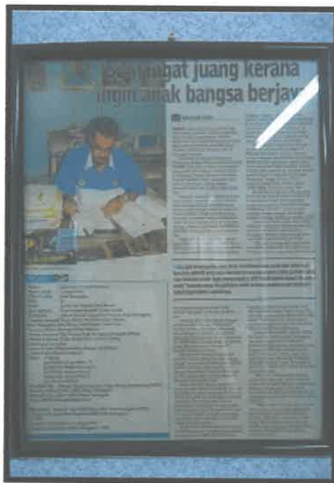
Gambar 6: Keratan Akhbar Semangat Juang