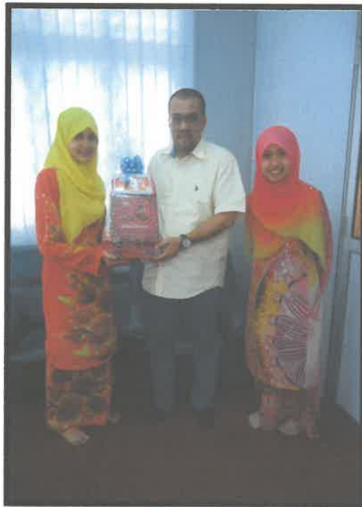
Gambar 2: Sesi Penyampaian Cenderahati