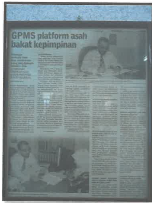
Gambar 5: Keratan Akhbar tentang Bakat Kepimpinan