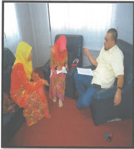
Gambar 1: Sesi Wawancara Bermula