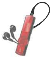
Gambar 6: MP3

Penulis menggunakan alatan seperti MP3 untuk merakam suara tokoh GPMS iaitu Tuan Syed Anuar bin Syed Mohamad supaya suara beliau boleh didengar dengan jelas dan tepat bagi melancarkan lagi proses kajian penulis.