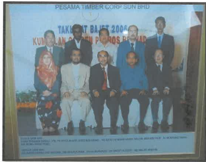
Gambar 7: Kenangan Bersama Rakan Seperjuangan