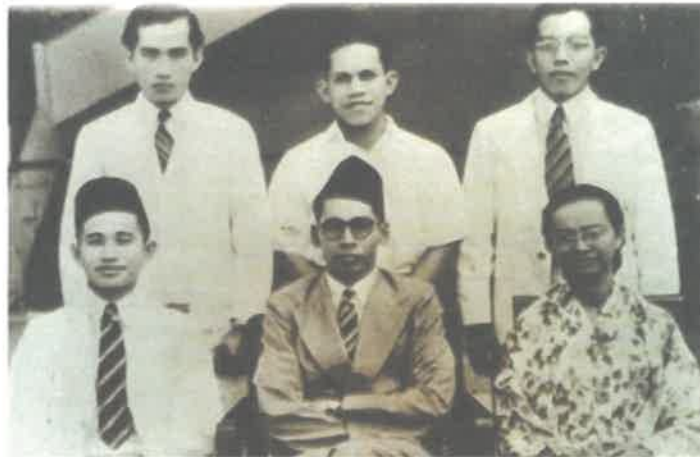
Aminuddin Baki, Abdul Wahab Ariff, Mohd Nor Marahakim, Abdullah Majid, Wan Sulaiman Pa'wanteh dan Siti Hasmah Mohd Ali.