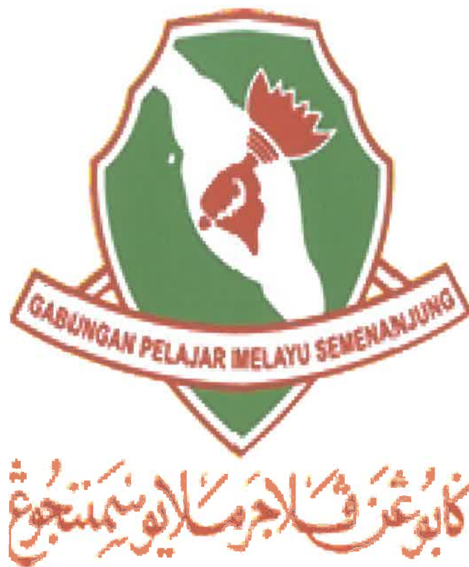
Gambar 10: Logo Gagasan Melayu Semenanjung Malaysia