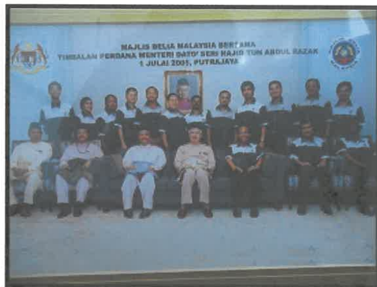
Gambar 8: Kenangan Bersama Perdana Menteri