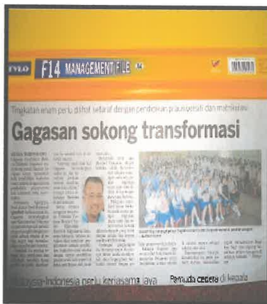
Gambar 4: Keratan Akhbar tentang Gagasan