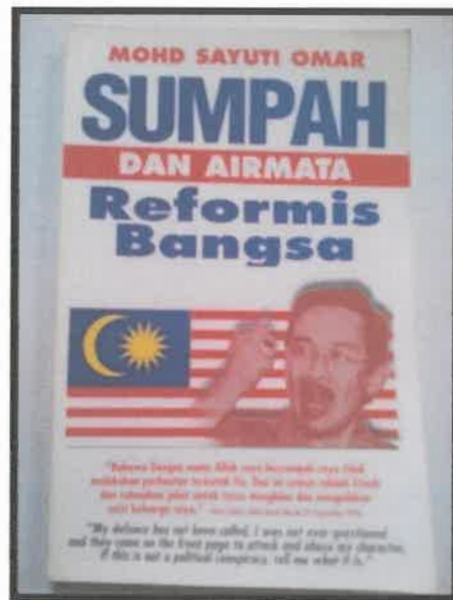
Gambar 1: Sumpah dan Airmata Reformasi Bangsa yang diterbitkan oleh Tinta Merah pada tahun 1998.