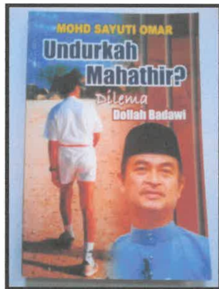
Gambar 2: Buku yang berjudul Undurkah Mahathir? Dilema Dollah Badawi yang diterbitkan oleh Tinta Merah pada tahun 2003.