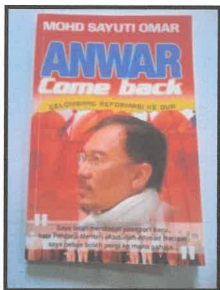
Gambar 3: Buku berjudul Anwar Come Back: Gelombang Reformasi Ke Dua yang diterbitkan oleh Tinta Merah pada tahun 2004.