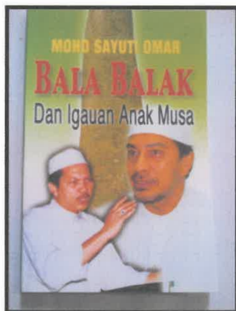
Gambar 4: Buku berjudul Bala Balak Dan Igauan Anak Musa yang diterbitkan pada Mei 2005.