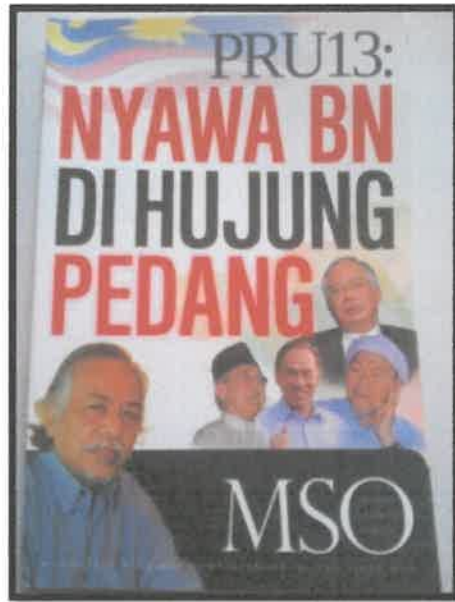
Gambar 5: Buku yang berjudul PRU13: Nyawa BN di Hujung Pedang yang diterbitkan oleh Tinta Merah pada tahun 2012.