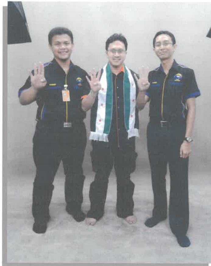
Gambar 4 : Bergambar selepas sesi temuramah