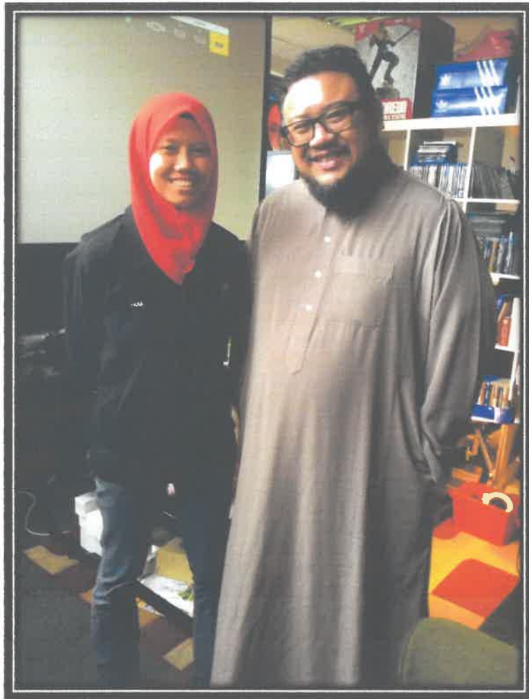
GAMBAR 3 : BERGAMBAR SELEPAS TEMURAMAH