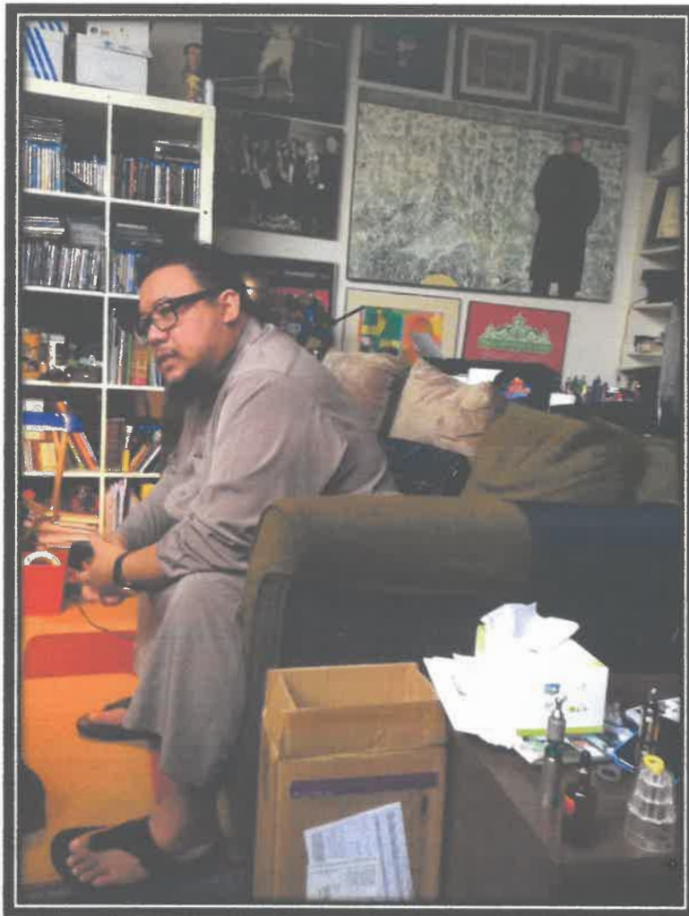
GAMBAR 1 : GAMBAR KETIKA SESI TEMURAMAH