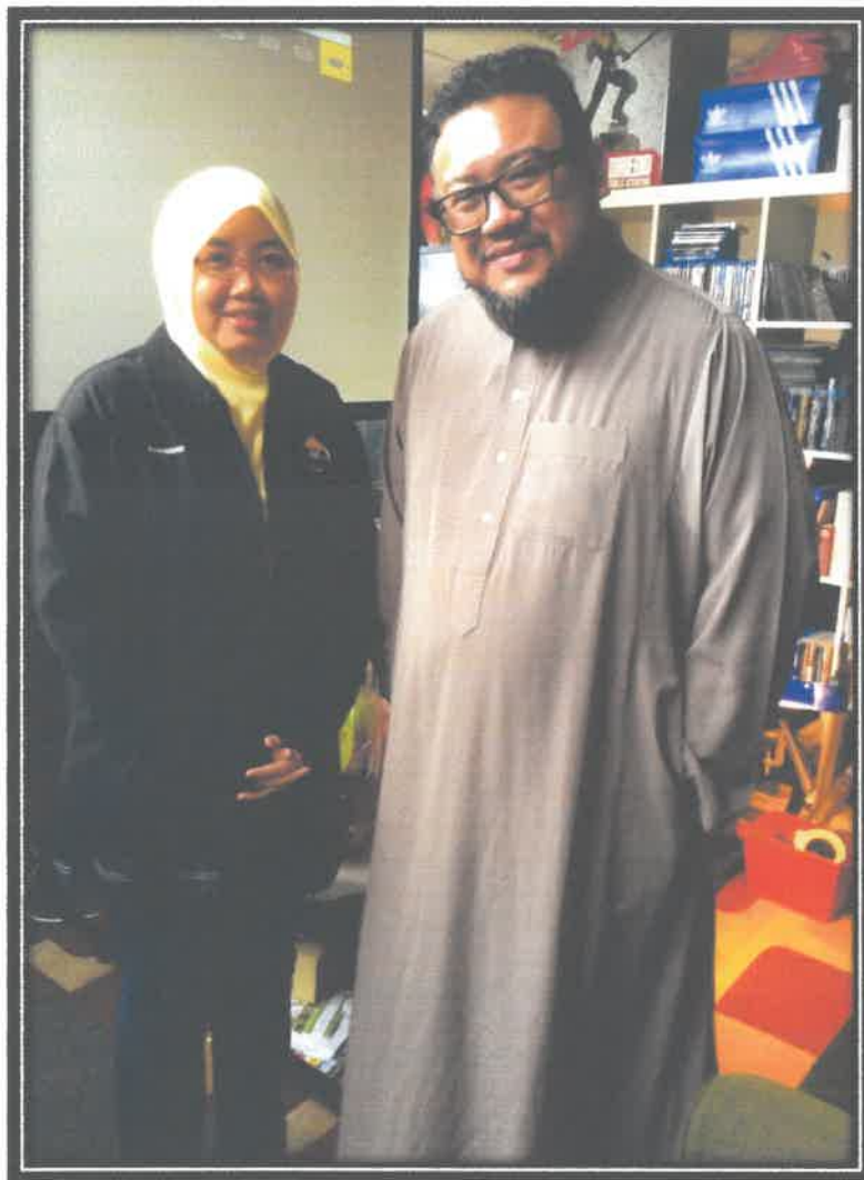
GAMBAR 4 : BERGAMBAR SELEPAS SESI TEMURAMAH