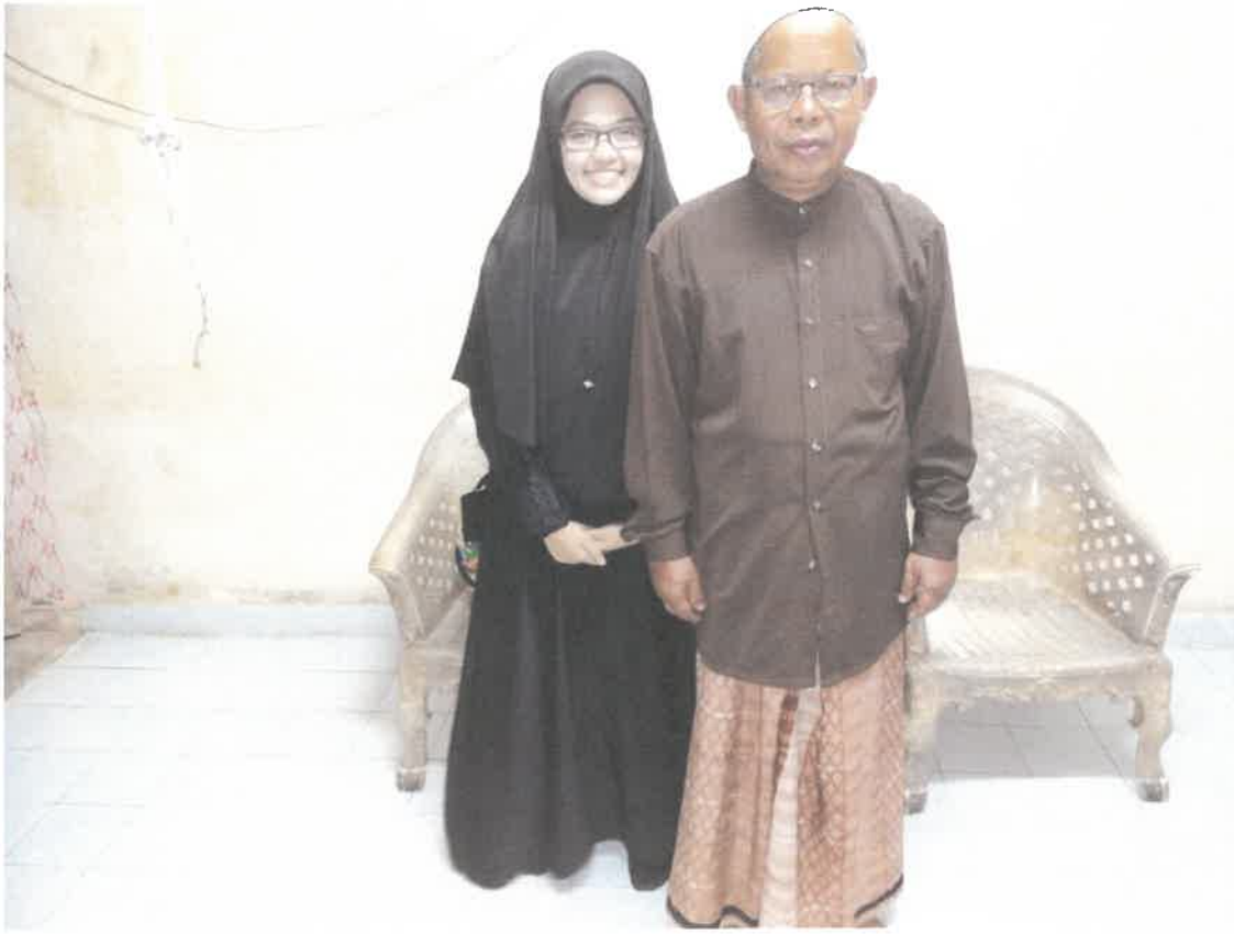
Gambar 3: Bersama Tokoh