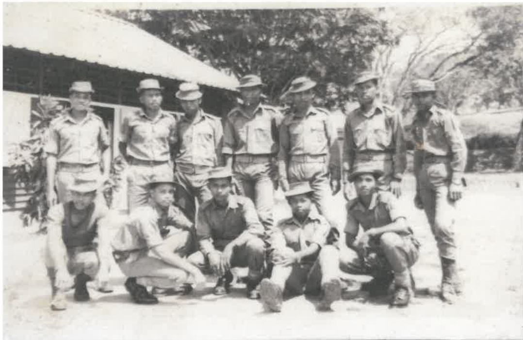
Gambar 3: Tokoh Sewaktu dalam Askar