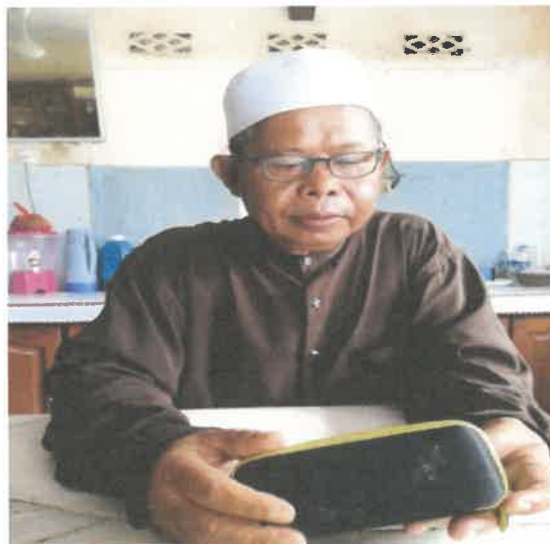
Gambar 1: Tokoh Sewaktu di Temubual