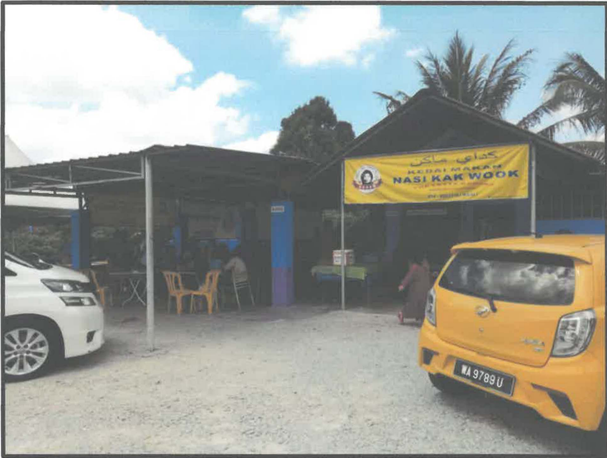
Gambar 1: Lokasi Kedai Nasi Kak Wook Cawangan Telipot, Kota Bharu, Kelantan