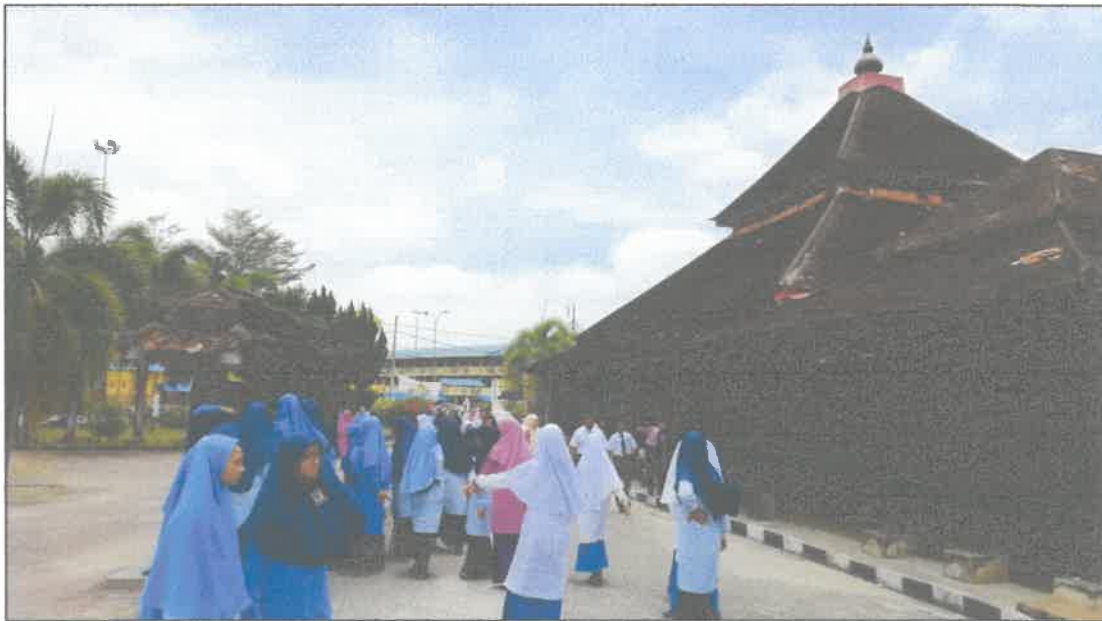
Gambar 2: Gambar ketika mempunyai lawatan dari sekolah