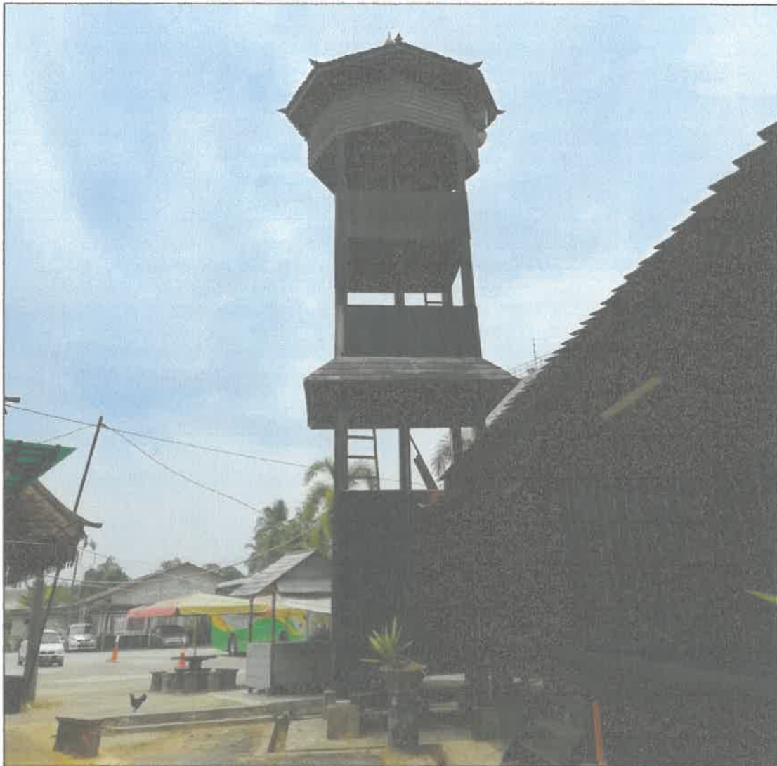
Gambar 4: Gambar menara azan Masjid Kampung Laut