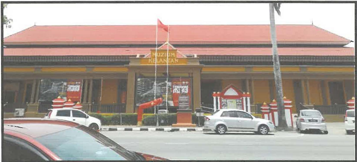
Gambar 2: Muzium Negeri Kelantan