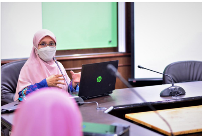
Sesi ta'aruf bersama Akademi Pengajian Islam dan Kontemporari