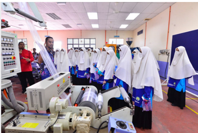
Pelajar dan guru dibawa melawat ke Makmal