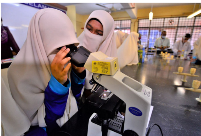
Pelajar mencuba alatan di makmal kimia