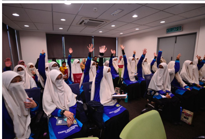
Para pelajar menunjukkan minat semasa sesi penerangan mengenai UiTM