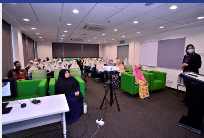
Sesi taklimat bersama Unit Komunikasi Korporat