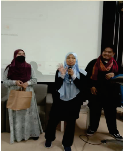
Sesi soal jawab aktiviti kuiz uji minda