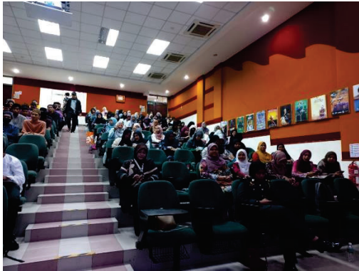
Gambar E: Peserta Forum Kelestarian Alam 'More Green More Clean'