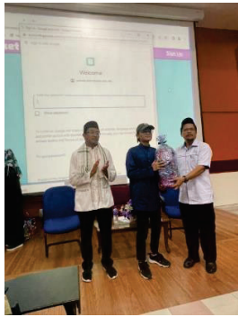
Gambar D: Penyampaian hadiah kepada Pelajar yang berjaya menjawab Kuiz

Tepat jam 11.10 Pagi maka selesai Forum Kelestarian Alam ' More Green More Clean' dan moderator Program membuat kuiz Green Waste kepada pelajar-pelajar KKTM Rembau. Alhamdulillah pelajar-pelajar telah berjaya menjawab semua soalan-soalan yang diberikan dalam masa 7 Minit. Acara diteruskan dengan sesi penyampaian cenderamata kepada ahli panel. Selain itu penyampaian hadiah juga diberikan kepada kumpulan pelajar yang berjaya menjawab soalan kuiz. Antara hadiah lain yang menanti pelajar adalah Program Kuliah Muslimat dan Talk Show. Program berakhir dengan jamuan makan di Medan Selera KKTM Rembau. Semoga