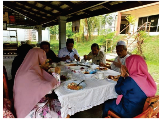
Gambar F: Jamuan Makan bersama Pengurusan KKTM Rembau, SWCorp, Pertubuhan IKRAM Rembau serta Pengerusi Kariah Masjid Kundur Hilir