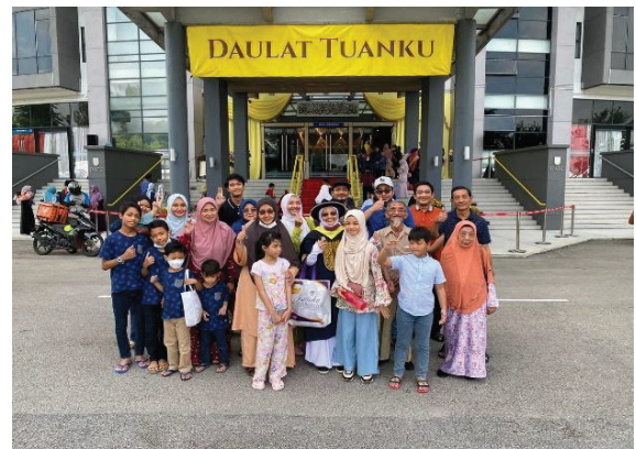
Gambar 3. Bersama keluarga besar tersayang

Sekian nukilan dari saya yang tak seberapa ni. Perjalanan hidup kita tak sama. Tapi pengakhiran kita sama (akhirat). Segala yang baik dari perkongsian ini ilham dari Allah dan yang buruk dari kekhilafan saya sendiri. Wallahualam.