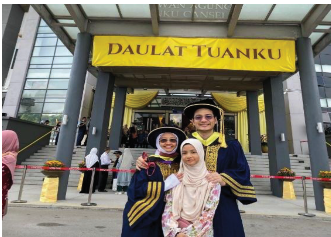
Gambar 2. Keluargaku syurgaku