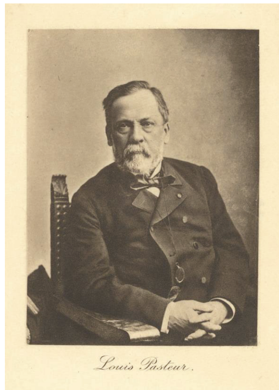
Gambar 1 & 2. (Kiri) Alexander Flemming dan (Kanan) Louise Pasteur

Justeru, adakah makmal diperlukan bagi menghasilkan atau membolehkan berlakunya perkembangan teknologi? Pada pengamatan penulis, ya ianya diperlukan. Seseorang individu itu mungkin mempunyai ilmu sains yang mendalam atau berkeupayaan dalam mencipta, tetapi jika tidak mempunyai peralatan atau instrumen yang bersesuaian sudah tentu akan menemui kegagalan. Di sinilah, makmal diperlukan sebagai medium bagi merealisasi dan mengubah penemuan atau penerokaan ilmu sains melalui keupayaan dalam mencipta dan membangunkan sesuatu teknologi yang baharu. Walaupun terdapat sesetengah pendapat yang menyatakan bahawa makmal tidak diperlukan kerana kewujudan alam sekitar ini sendiri adalah sebuah makmal dalam kalangan segelintir individu yang genius di mana mereka dianugerahkan kemudahan untuk mencipta dan memahami sesuatu kejadian tanpa melalui pembelajaran yang formal, namun penulis berpendapat bahawa pemahaman ilmu sains dan keupayaan untuk mencipta memerlukan ilmu asas, minda yang sentiasa berfikir dan pemikiran kritis yang hanya boleh dipupuk melalui pembelajaran yang formal dan bersistematik.