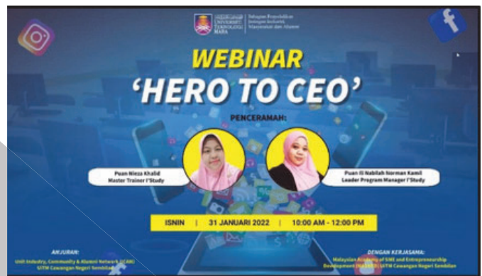
Poster Program Webinar 'Hero to CEO'