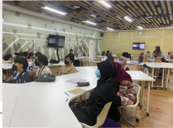
Peserta yang menyaksikan secara langsung di Smart Classroom, Kampus Kuala Pilah