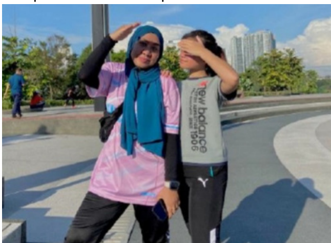
Peserta menamatkan larian 'MassComm Golden Jubilee 5KM Virtual Run

Larian secara maya ini adalah kali pertama dianjurkan untuk meraikan Masscom yang ke- 50 tahun. Mendapat sambutan yang sangat baik daripada kalangan pelajar, alumni, orang awam dan aktiviti larian ini harus di teruskan sejajar dengan usaha kerajaan untuk memberi kesedaran kesihatan dan menggalakkan rakyat Malaysia untuk kekal aktif dimana pandemik telah menjejaskan gaya hidup sihat seseorang. Semoga aktiviti sihat seperti ini dapat dikekalkan dan diteruskan pada masa hadapan.