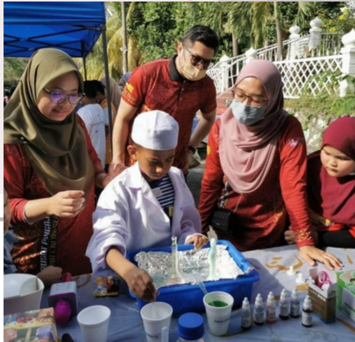
Aktiviti kajian sains yang dipraktikkan oleh anak flat Semarak

Berikutan pengumuman penamatan Perintah Kawalan Pergerakan (PKP) oleh Kerajaan Malaysia baru-baru ini akibat daripada pandemik COVID-19 telah mencetuskan idea untuk pelaksanaan aktiviti khidmat masyarakat secara bersemuka dengan golongan sasaran yang memerlukan. Berdasarkan kepada perbincangan yang telah dibuat di antara ahli-ahli jawatankuasa yang telah dilantik di peringkat Pusat Pengajian Kimia dan Alam Sekitar (PPKAS), Universiti Teknologi MARA Cawangan Negeri Sembilan (UiTM CNS), Kampus Kuala Pilah, telah sebulat suara bersetuju untuk melaksanakan program berteraskan aktiviti pendidikan terarah yang menyasarkan golongan pelajar berumur di antara 10-12 tahun. Antara objektif utama pelaksanaan program ini adalah untuk menunaikan tanggungjawab CSR di peringkat universiti disamping menerapkan konsep "Kebajikan Tanggungjawab Bersama".