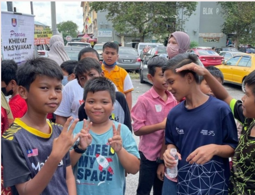
Anak-anak yang bermastautin di flat Semarak, Nilai gembira terima kunjungan UiTM

Usaha yang dilaksanakan ini boleh digambarkan sebagai dakwah kepada golongan yang memerlukan dengan kaedah memberikan sumbangan kepada golongan memerlukan (dakwah bil hal). Dalam pada itu, aktiviti ini dapat dizahirkan sebagai program yang berjaya kerana melibatkan pelbagai pusat/jabatan pengajian dan mendapat sambutan yang baik dikalangan peserta. Tambahan bantuan yang turut diberikan berupa barangan keperluan harian diharap dapat membantu keluarga kurang berkemampuan di kawasan terbabit.