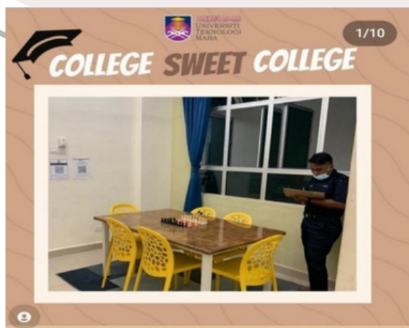
Sesi penjurian pertandingan

Sesi penjurian bermula pada 20 Jun 2022 dimana seramai 12 orang juri di kalangan staf UiTM ditugaskan untuk menilai kolej, rumah dan bilik pelajar mengikut rubrik pemarkahan yang telah disediakan. Pelbagai komen dan reaksi diterima daripada hasil penilaian juri antaranya kebanyakan pelajar bersedia dan menyahut cabaran pertandingan ini dengan keadaan rumah dan bilik yang menepati kriteria yang ditentukan. Ia menyebabkan pihak juri mengalami kesukaran dalam menentukan markah dan memilih pemenang.