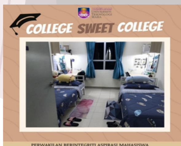
PERWAKILAN BERINTEGRITI ASPIRASI MAHASISWA Bilik pelajar yang bersih dan ceria

Program berakhir dengan sesi penyampaian hadiah kepada pemenang pada 2 Julai 2022 sempena program Rembau Badminton Championship 2.0. Kolej Dato' Shahbandar dinobatkan sebagai kolej terbaik secara keseluruhan bagi semester ini.