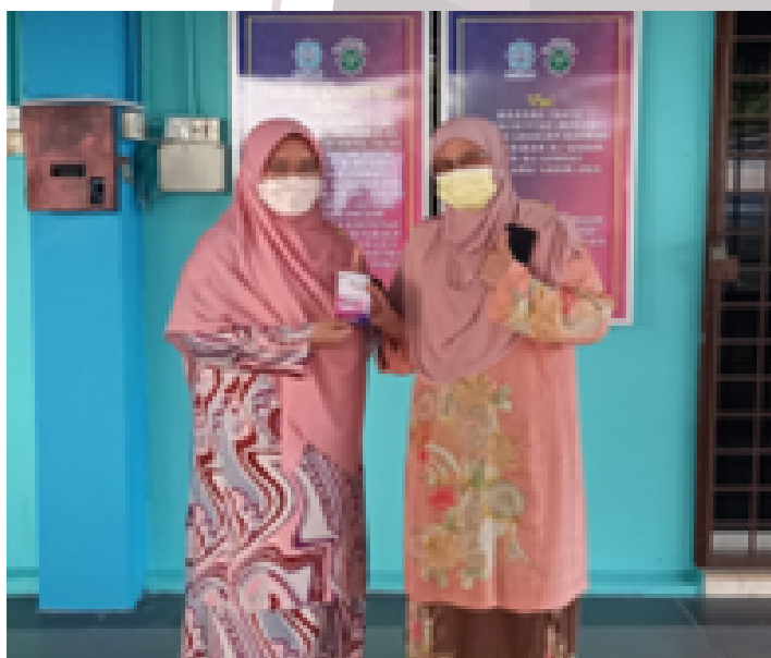
Serahan sumbangan tunai kepada wakil Maahad Tahfiz As-Sa'idiyyah, Seremban.