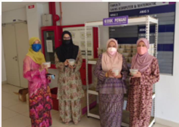
Agihan bubur lambuk kepada pelajar dan staf FSKM oleh Ketua Pusat Pengajian FSKM.

Program Kasih Ramadhan FSKM 2022 ini amat signifikan buat FSKM kerana ianya adalah program yang pertama diadakan bersama staf dan mahasiswa secara bersemuka selepas pandemik COVID-19 melanda Malaysia bermula Mac 2020. Diharapkan program ini berjaya menjalinkan silaturrahim antara mahasiswa bersama pensyarah-pensyarah setelah hampir dua tahun kampus Seremban sunyi dari aktiviti-aktiviti pelajar. Dengan keberadaan sebahagian daripada mahasiswa berada di kampus dan kedatangan bulan Ramadhan yang mulia, program ini amat sesuai untuk dijalankan. Dengan banyaknya kelebihan dan ganjaran di bulan Ramadhan, FSKM Kampus Seremban bercadang untuk meneruskan program seperti ini pada tahun-tahun hadapan sebagai program tahunan. FSKM juga berharap banyak lagi program kemasyarakatan dapat dilaksanakan dengan komuniti setempat di masa hadapan.