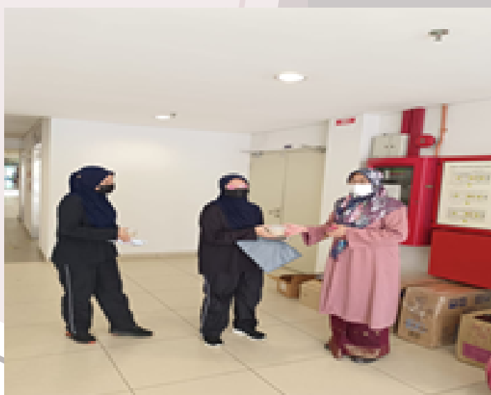
Agihan bubur lambuk kepada pelajar dan staf FSKM oleh Ketua Pusat Pengajian FSKM.