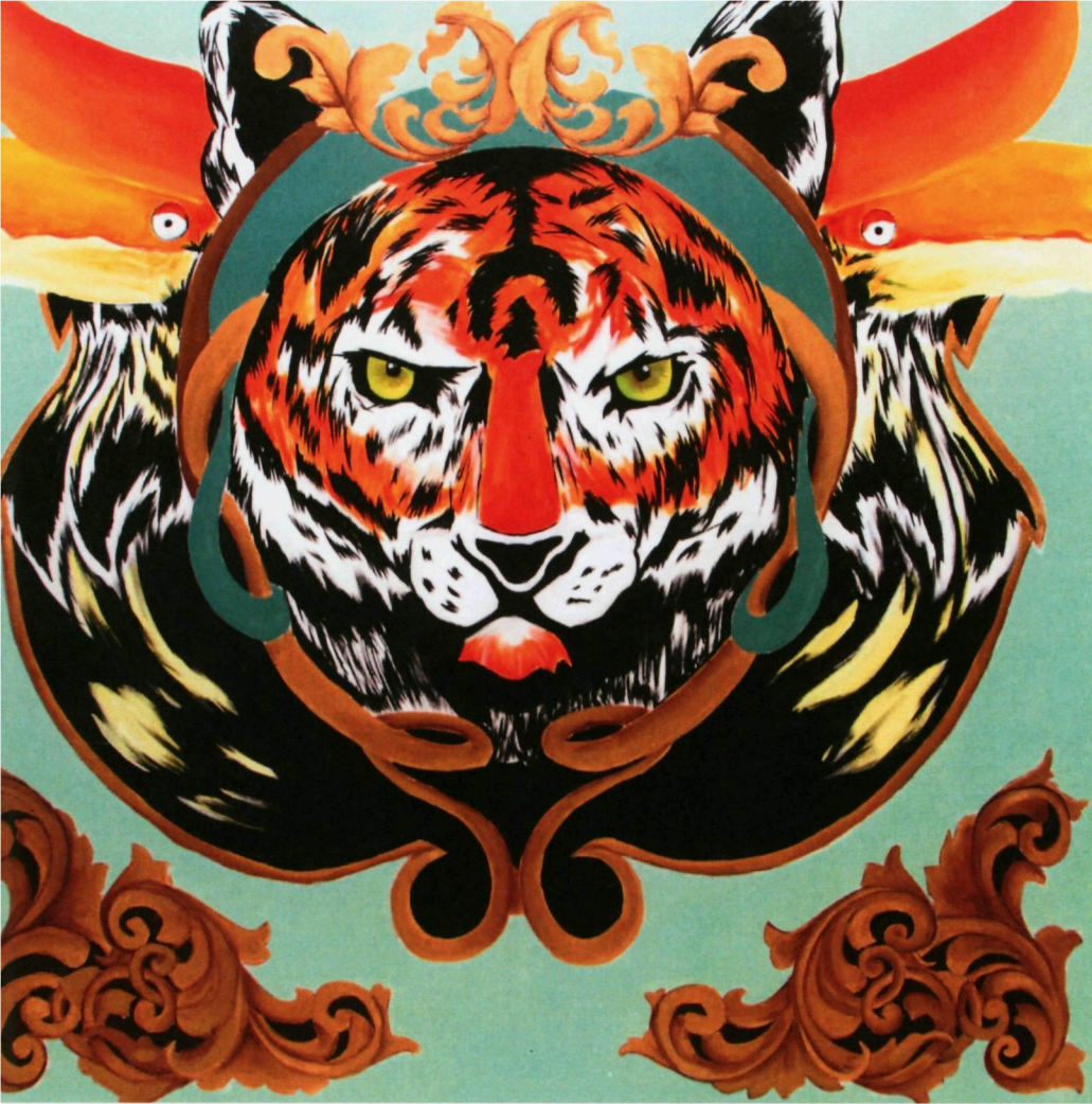
7. JINGGA (2017) | NURUL FAAIZA ABDUL RAZAK

Harimau dan burung Enggang antara haiwan yang semakin pupus di Malaysia. Pengkarya cuba mengaitkan ia dengan penampilan motif ukiran kayu yang juga merupakan salah satu warisan budaya yang semakin dilupai. Jingga menjadi tajuk karya yang memberi konotasi bahaya serta perlukan perhatian yang serius dan segera.