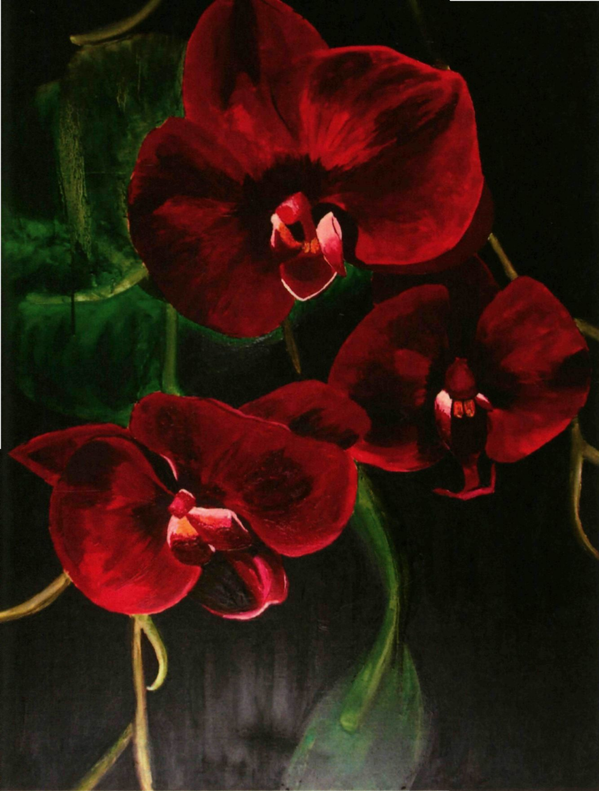
29. THE EXCELLENT OF EXISTENCE (2018) | NURUL HANNANI RAZALI

Bunga Orkid adalah bunga yang sangat jarang untuk berbunga tetapi ia akan berbunga dengan lebih kerap jika dijaga dengan penuh kasih sayang, cinta, belaian dan perhatian yang cukup. Ia boleh berbunga selama 3 bulan jika ia dijaga bagai "menatang minyak yang penuh". Begitu juga wanita, jika dibelai, dijaga dengan penuh kasih sayang, cinta, perhatian dan sokongan yg ikhlas dan secukupnya, wanita akan menjadi seorang yg berjaya kental, yakin pada diri & kuat menempuhi segala rintangan.