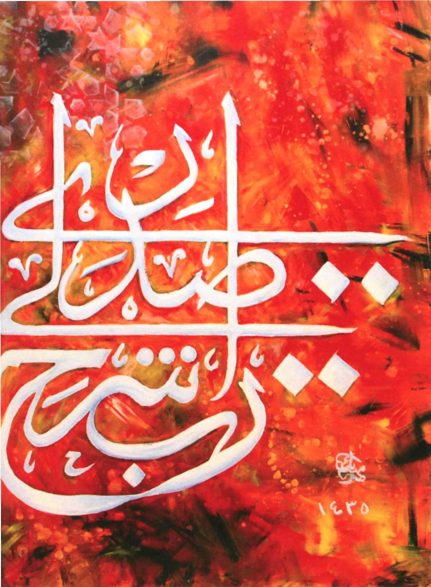
13. PENAWAR HATI (2018) | NUR AZWA MUHAMAD YUSOF

Petikan dari Surah Taha ayat 25-28 yang membawa maksud penerang hati. Surah Taha ayat 25-28 ini dapat membantu meningkatkan dan menambah daya ingatan di samping zat surahnya yang mempermudah segala urusan manusia.