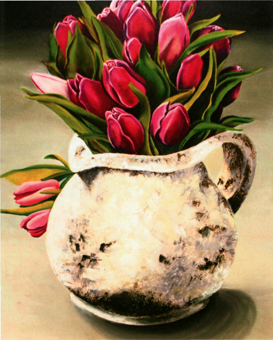
39. TULIPS (2018) | ANA NAJWATUNISAA MUZAFFAR SHAH

Karya ini menunjukkan cerminan kehidupan saya. Sekuntum bunga tulip memberi simbol seperti diri saya yang merupakan seorang anak tunggal dalam keluarga. Warna tulip yang berwarna campuran merah dan merah jambu ini melambangkan keceriaan dan kasih sayang malah menunjukkan bahawa diri saya ini dikelilingi dengan kasih sayang yang tidak berbelah bahagi oleh ibu bapa, keluarga dan rakan-rakan. Oleh itu, karya ini saya tujukan kepada keluarga saya khususnya ibu saya yang banyak memberi sokongan dan juga seorang yang suka akan bunga tulip.