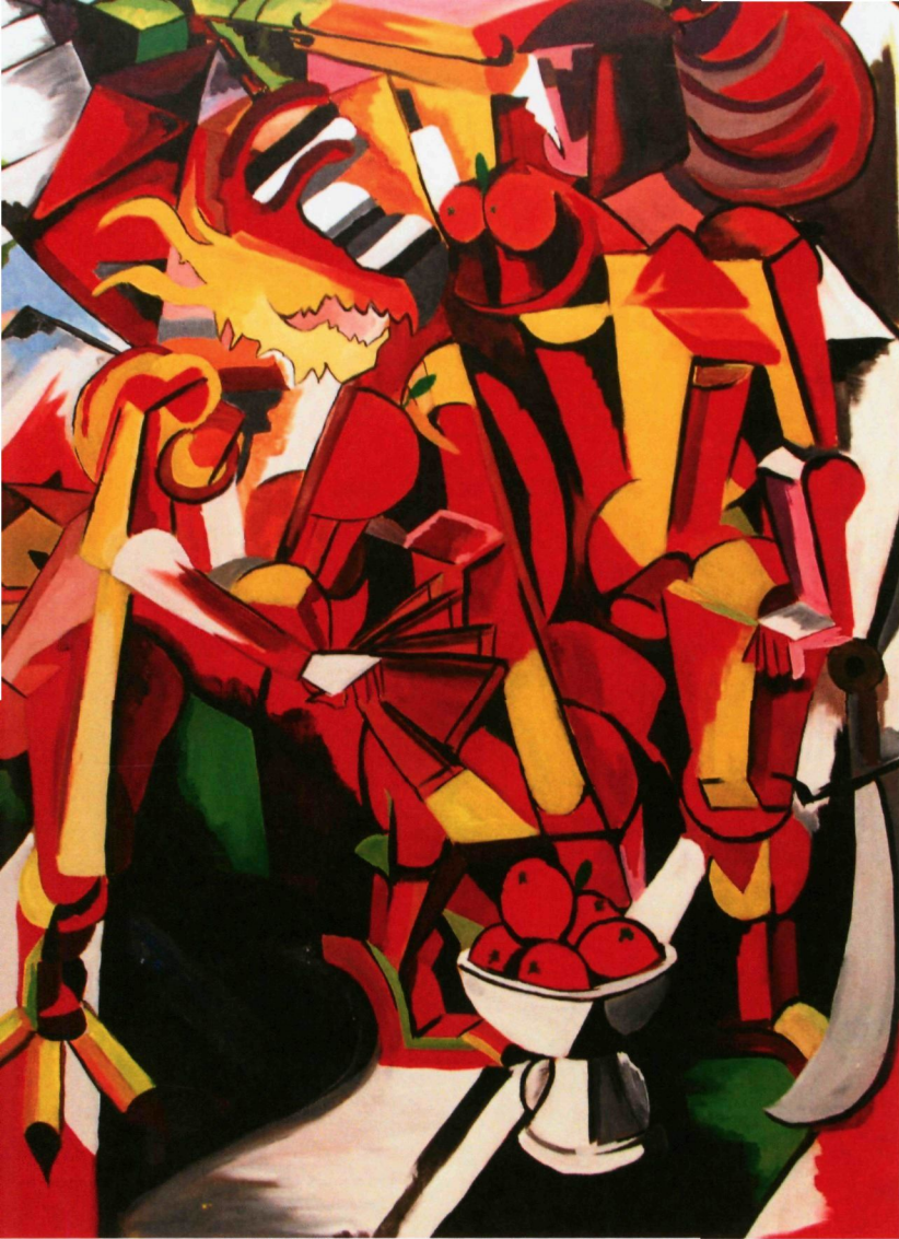
5. HUAREN XINNIAN (2017) | AHMAD LUQMAN HEGRETUL AL-AMIN

Karya ini merupakan gabungan aliran KUBISME dan KONSTRUKTISME yang mengisahkan tentang "HUAREN XINNIAN" yang bermakna tahun baru cina. Ia menceritakan tentang budaya masyarakat cina melalui konsep KUBISME. Naga melambangkan tarian perayaan, figura manusia pula mewakili ZAO ZILONG iaitu jeneral tertinggi pada zaman pemerintahan cina dahulu. Terdapat juga elemen lain seperti ang pow, buah limau, tokong cina selain rona merah, jingga, dan kuning yang sinonim dengan kekuatan dan tuah dalam kepercayaan masyarakat cina.