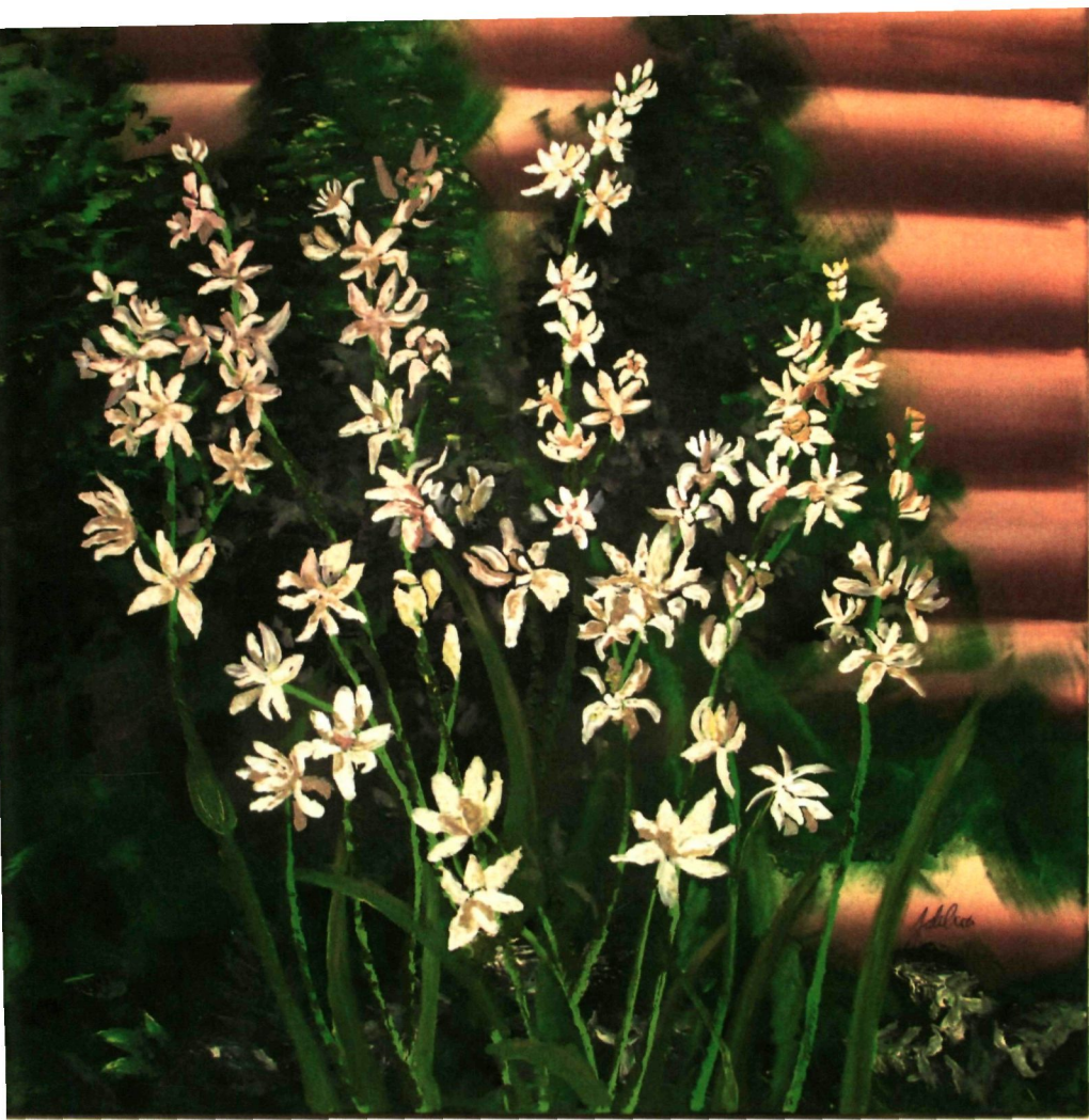
15. MITOS (2018) | FARAH FAKHIRA ZULBAHRI

Bunga Harum Sundal malam diambil sebagai subjek utama untuk menunjukkan keunikan dan keistimewaan bunga ini. Bunganya yang hanya akan kembang dan mengeluarkan bau yang amat wangi pada malam yg tertentu sahaja telah mencetuskan kepercayaan mistik yang pelbagai di kalangan rumpun Melayu.