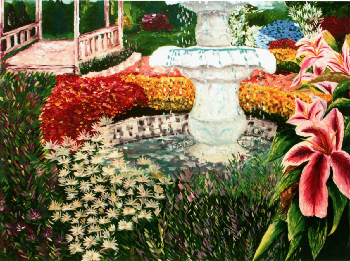
31. GARDEN OF FLOWER (2017) | HATIKA ABDUL HALIM

'Garden of Flower' mengambi inspirasi aliran Impressionism yang bersifat naturalistik dan lanskap dengan mengutamakan elemen 'Capture The Moment' dalam penghasilan karya.