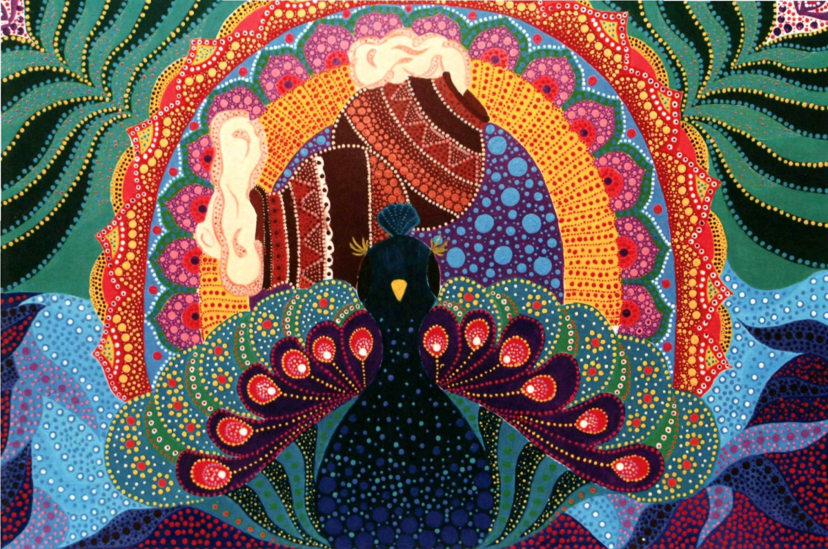
19. THE MIX KOLAM (2018) | NURAI SYAH AMFRAN

Motif utama untuk menghasilkan karya ini ialah "KOLAM atau RANGOLI ART" . Kolam merupakan lukisan di atas lantai. Kolam dalam bahasa tamil membawa maksud indah atau cantik. Karya ini berfokuskan kepada dua kolam hasil gabungan daripada perayaan tradisi kaum India iaitu perayaan Pongal dan perayaan Deepavali ( pesta cahaya) . Dua tembikar yg dilimpahi susu mewakili kolam perayaan Pongal yang membawa maksud kekayaan yang melimpah ruah dan burung merak mewakili kolam perayaan Deepavali ( pesta cahaya ) yang beerti cahaya menerangi kegelapan ke arah kebaikan.