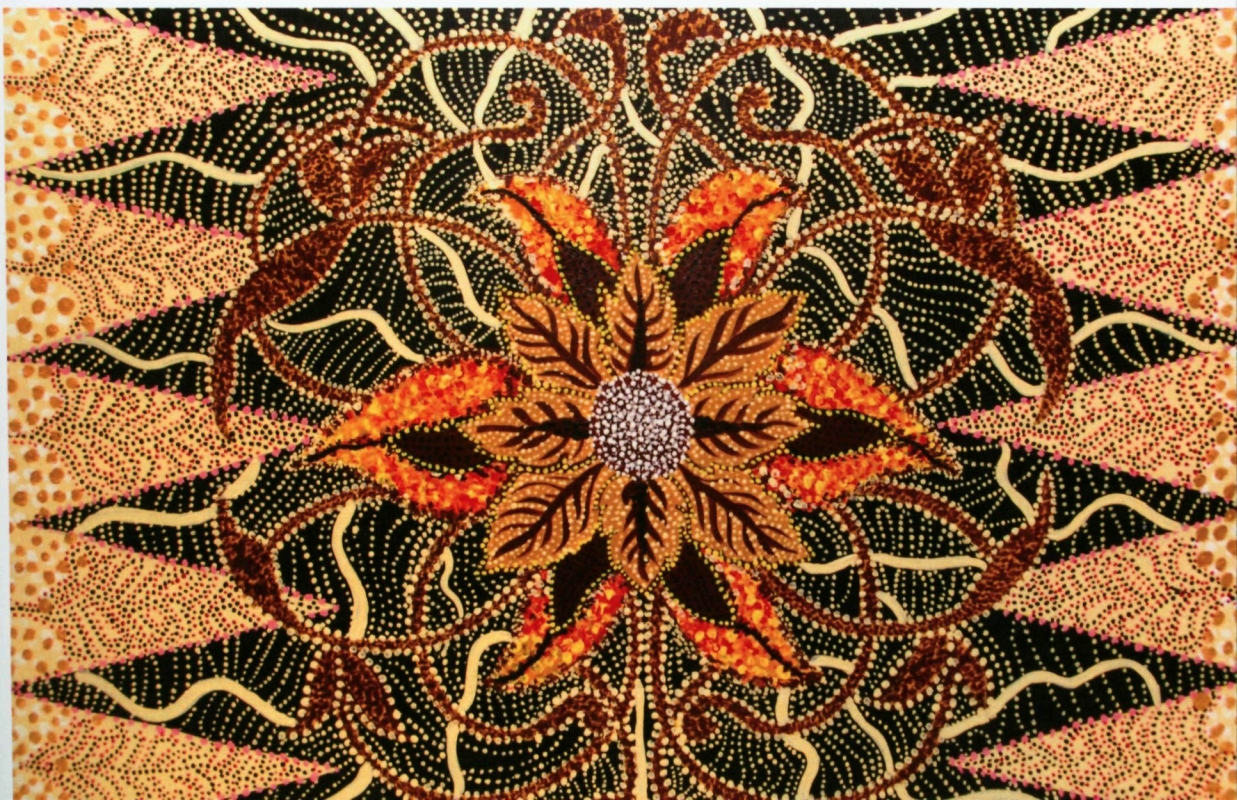
18. SERI MELUR (2018) | CHE SURAYA AZIZ

Karya ini bertemakan gabungan seni Aboriginal dan Tradisional Melayu kerana ingin menerapkan unsur seni moden barat dan tradisional Melayu. Unsur corak flora iaitu motif bunga melur dipilih kerana merupakan motif hiasan yang sangat penting digunakan dalam ukiran kayu tradisional Melayu kerana motif sulur pautnya yang lembut dan menjalar mudah diubahsuai bentuk. Corak batik bermotifkan pucuk rebung dan gabungan corak titik secara berirama sebagai latar belakang ukiran tersebut menunjukkan gabungan erat di antara gabungan seni ukiran kayu dan batik yang tidak akan di telan zaman dan masih dihargai oleh masyarakat kini.