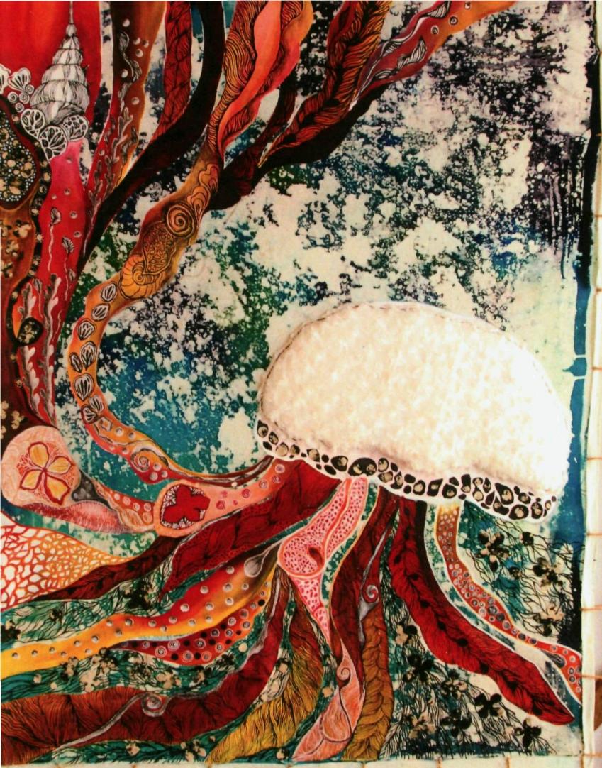
11. THE JELLY FATHER (2018) | FATIN ADIBAH ISMAIL

Karya ini menjadikan obor-obor sebagai subjek utama dengan menggambarkan seorang bapa yang bertekad untuk menghadapi segala rintangan. Seorang bapa yang berkemampuan melakukan sesuatu buat keluarganya tanpa keluhan. Obor-obor, mampu melindungi diri dengan keberanian, kecekalan dan kelebihan yang ada begitulah juga simboliknya ia dengan keupayaan seorang bapa yang tiada tandingan, rela melakukan sesuatu untuk keluarganya.