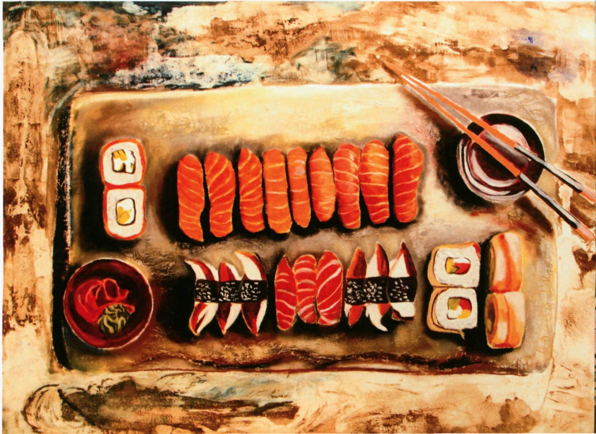
36. SUSHI (2018) | AINOL HAYAT AB GHAFAR

Karya ini mengenai makanan kegemaran masyarakat jepun iaitu sushi. Sushi adalah makanan yang terdiri daripada nasi yang dibentuk bersama lauk berupa makanan laut, daging dan sayuran yang mentah ataupun dimasak. Nasi sushi itu sendiri sangat lembut kerna diperbuat daripada nasi yang dicampur dengan cuka beras, garam dan gula. Sushi juga menjadi makanan kegemaran masyarakat Malaysia masa kini.