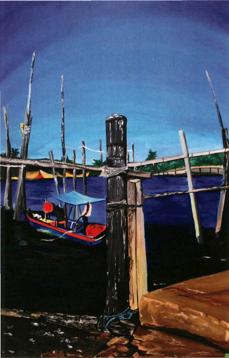
23. TANJUNG LUMPUR (2018) | NUR ASYIKIN MUHD HUSIN

Tanjung Lumpur merupakan sebuah perkampungan memancing yang terletak berhampiran Sungai Kuantan di Pahang, Malaysia.