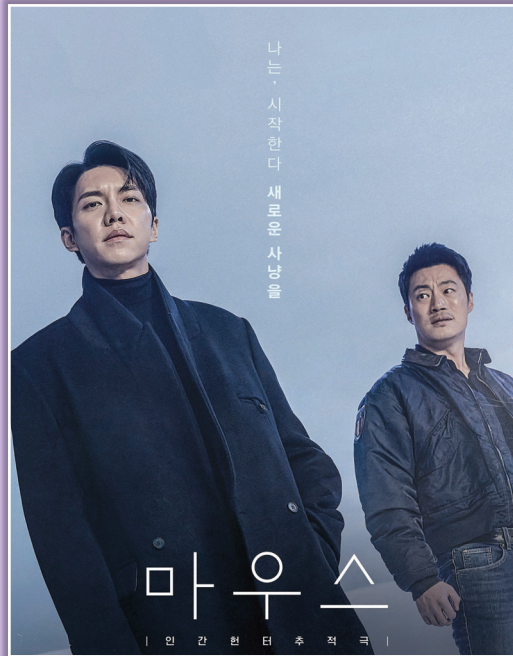
Dari kiri: Lee Seung-Gi dan Lee Jee-Hoon

Di sebalik tanggungjawab sebagai seorang pegawai polis, sebenarnya Ba-Reum adalah psikopat yang telah menyebabkan keres-