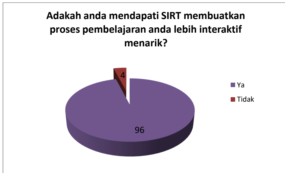
Rajah 2: Pendapat pelajar tentang SIRT yang membuatkan pembelajaran lebih interaktif dan menarik

Rajah 1 diatas menunjukkan tahap kesukaan menggunakan SIRT. Didapati 66 orang pelajar sangat menyukai SIRT dan hanya 5 orang pelajar sahaja yang kurang menyukai SIRT. Ini mungkin kerana ada sesetengah pelajar yang tidak mempunyai kemahiran dalam menggunakan telefon bimbit dan aplikasi yang terdapat di dalam telefon bimbit.