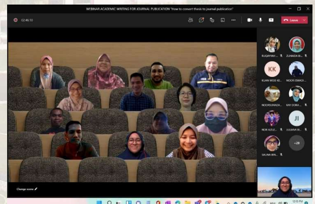
Sesi bergambar bersama peserta