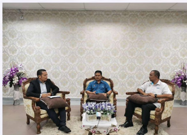
Program Pertama: Industrial Talk with IAP Panels for EC110 Gambar (kiri): Persiapan AJK Multimedia bagi program Industrial Talk with IAP Panels for EC110 ; Gambar (kanan) : Moderator program bersama panel jemputan.

Program kedua pula adalah Mesyuarat Bersama Panel IAP yang berlangsung pada 20 Oktober 2021 dan dijalankan secara bersemuka. Tujuan utama mesyuarat ini adalah bagi mendapatkan maklumbalas dari panel industri berkenaan kandungan silibus Diploma Kejuruteraan Awam (EC110) untuk tujuan penambahbaikan kepada silibus Diploma EC110 yang sedang dijalankan bagi cohort semasa. Hanya tujuh (7) kursus tahun akhir yang dipilih untuk pembentangan silibus iaitu; ECG353 Soil Engineering , ECS358 Civil Engineering Design Project , ECW331 Water and Wastewater Engineering , ECW341 Water Engineering Laboratory , ECG344 Highway Engineering , ECS338 Structural Concrete and Steel Design dan ECM336 Civil Engineering Quantities and Estimation . Kedua-dua panel berpendapat secara keseluruhannya kandungan kursus adalah mencukupi dan sejajar dengan keperluan industri. Namun begitu, panel turut mencadangkan beberapa sub-topik boleh ditambah di dalam kursus ECG344 Highway Engineering , ECW331 Water and Wastewater Engineering dan ECS358 Civil Engineering Design Project sebagai pengenalan kepada para pelajar.