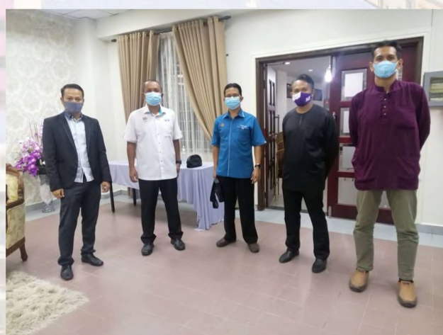
Program Pertama: Industrial Talk with IAP Panels for EC110 Gambar (atas/bawah): Bergambar kenangan bersama Panel IAP bagi program Industrial Talk with IAP Panels for EC110