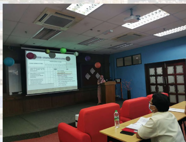
Program Kedua: Mesyuarat Bersam Panel IAP Gambar (atas): Pembentangan silibus kursus ECM336 Civil Engineering Quantities & Estimation oleh Puan Nor Janna Tammy; Gambar (bawah) Pembentangan silibus kursus ECS338 Structural Concrete & Steel Design oleh Puan Daliah Hassan.