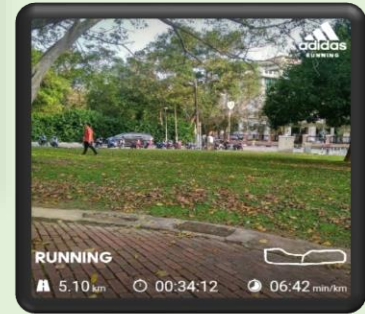
Screen shot larian peserta “Coronapocalypse Virtual Run 2020”