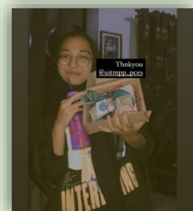
Pemenang Video Competition 2020 bersama hadiah dimenangi