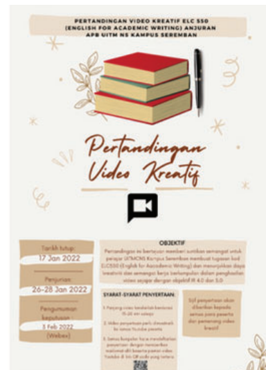
Poster hebahan pertandingan

Pertandingan video kreatif ini merupakan satu pertandingan berbentuk pembelajaran dalam talian (online learning), di mana semua pelajar yang mengambil subjek ELC550 dikehendaki menghasilkan sebuah video berdurasi 15 hingga 20 minit yang memaparkan pembentangan poster mereka. Tugas ini juga merupakan sebahagian daripada penilaian mereka (Assessment 2). ELC550 memperkenalkan para pelajar mengenai selok belok penulisan berunsurkan akademik. Antara kandungan yang dipelajari adalah pembentukan semula frasa (paraphrasing), pemilihan isi kandungan yang penting serta kaedah rujukan atau 'referencing' yang betul. Salah satu daripada tiga penilaian utama di dalam kod subjek ini adalah penghasilan poster yang terhasil melalui pemilihan intipati utama berdasarkan pembacaan daripada 4 artikel jurnal utama, yang berkaitan dengan tajuk yang dipilih. Setelah penghasilan poster, pelajar dikehendaki membuat satu pembentangan tentang poster tersebut.