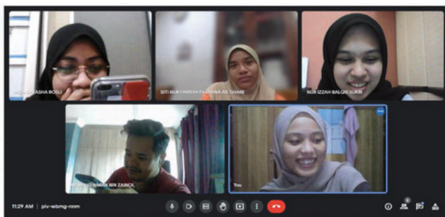
Para pelajar membuat perbincangan untuk penghasilan poster

Pertandingan ini melibatkan kerja kumpulan di mana setiap kumpulan terdiri daripada empat ahli. Mereka dikehendaki membaca empat artikel jurnal serta mengupas intipati idea-idea utama di dalam artikel tersebut. Perbincangan dalam kumpulan adalah secara mandiri, iaitu dikendalikan oleh pelajar sendiri. Melalui hasil perbincangan dan kupasan idea serta pengolahan semula, pelajar dikehendaki menghasilkan poster dalam bentuk video dan membentangkan kandungan poster tersebut. Terdapat dua fasa penilaian. Fasa pertama melibatkan penilaian pensyarah yang mengajar ke atas video pelajar bagi kelas masing-masing.. Fasa kedua pula adalah di mana pensyarah akan memilih dua video terbaik dari kelas yang diajar. Penilaian video dibuat oleh 14 pensyarah Bahasa Inggeris APB Kampus Seremban menggunakan Google Form yang telah disediakan.