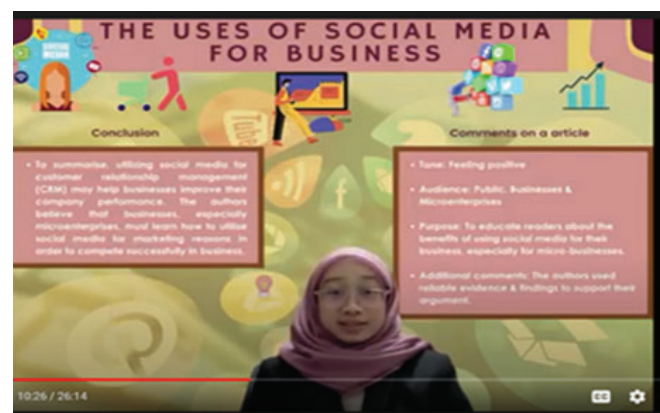
Contoh video yang dihasilkan pelajar