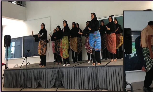
PERTANDINGAN DIKIR BARAT