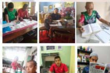
PERPUSTAKAAN TENGGU ANIS, UiTM KELANTAN