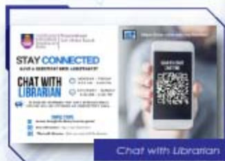
Chat with Librarian