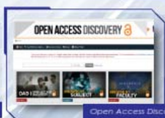
Open Access Discovery