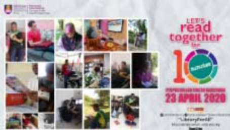
PERPUSTAKAAN SULTAN BADLISHAH UiTM CAW. KEDAH