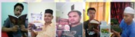
PERPUSTAKAAN CENDEKIAWAN, UiTM CAWANGAN TERENGGANU KAMPUS BUKIT BESI