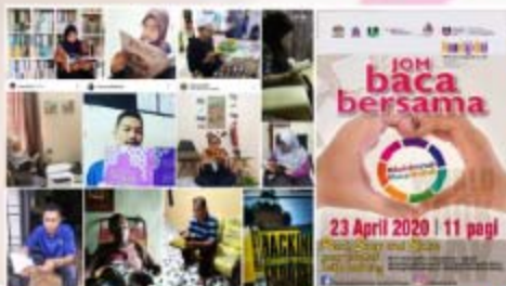
PERPUSTAKAAN DATO' JAAFAR HASSAN, UiTM PERLIS