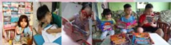
Perpustakaan Tun Abdul Razak UiTM Cawangan Sabah melibatkan anak-anak staf PTAR UiTM Sabah