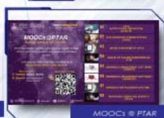
MOOCs @ PTAR