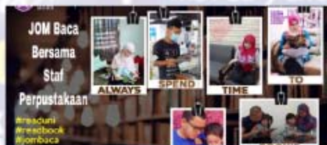
PERPUSTAKAAN TUN ABDUL RAZAK UiTM KAMPUS TAPAH