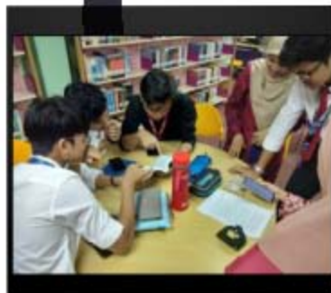
Aktiviti Info Hunt

Library Info Hunt telah berlangsung dengan jayanya di PTDI Kampus Segamat pada 10 Februari 2020. Aktiviti ini begitu meriah dengan kehadiran seramai 198 orang pelajar interim. Usaha ini dilihat dapat menarik minat pelajar baharu untuk mendalami lebih lanjut berkaitan fungsi dan peranan perpustakaan di sesebuah institusi. Aktiviti Info Hunt dilaksanakan dengan pelbagai pengisian berkaitan perkhidmatan dan kemudahan yang terdapat di PTDI.