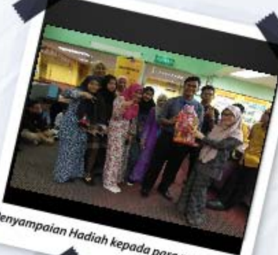
Penyampaian Hadiah kepada para pemenang