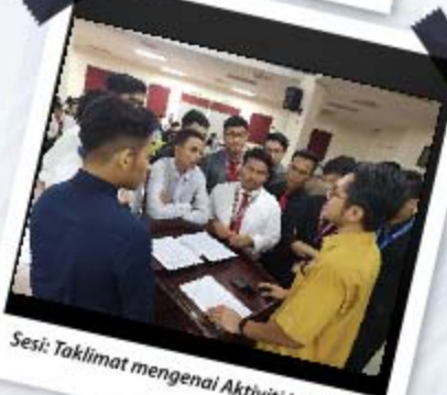
Sesi: Taklimat mengenai Aktiviti Info Hunt