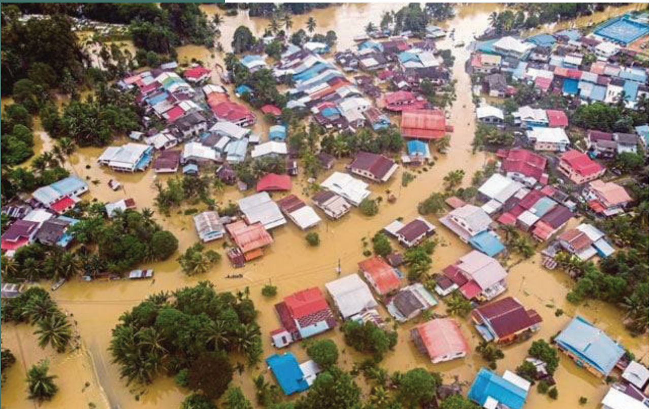
Bencana Banjir di Lembah Klang

Dengan keadaan wabak dan juga bencana banjir yang melanda negara sejak beberapa tahun, mahupun bulan yang lepas, komunikasi dilihat memainkan peranan penting bagi kehidupan manusia, kerana manusia itu sendiri dikenali sebagai individu yang bersosial. Setiap saat pasti manusia di dunia ini melakukan komunikasi, baik komunikasi verbal mahupun sebaliknya. Komunikasi adalah salah satu isu asas yang penting dalam perhubungan dan interaksi antara seseorang individu dengan individu ataupun kumpulan individu yang lain. Komunikasi ialah perhubungan yang wujud di antara penghantar ( sender ), yang merupakan individu yang menghantar mesej, dan penerima ( receiver ), yang akan menjadi penerima dan pembawa mesej tersebut. Kedua-dua berkongsi maklumat dan melalui maklumat tersebut mereka berkomunikasi. Walaupun, kadang-kadang proses komunikasi ini tidak begitu mudah dan kadang-kadang menimbulkan kekeliruan kerana adanya unsur-unsur lain seperti konteks, campur tangan, persoalan, dan kekeliruan yang ada di sekeliling mesej tersebut.