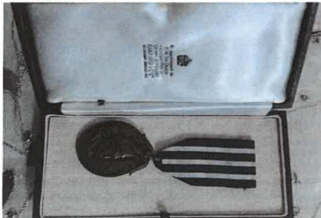
Rajah 2 Antara pingat yang dimiliki oleh Puan Wan Salmah