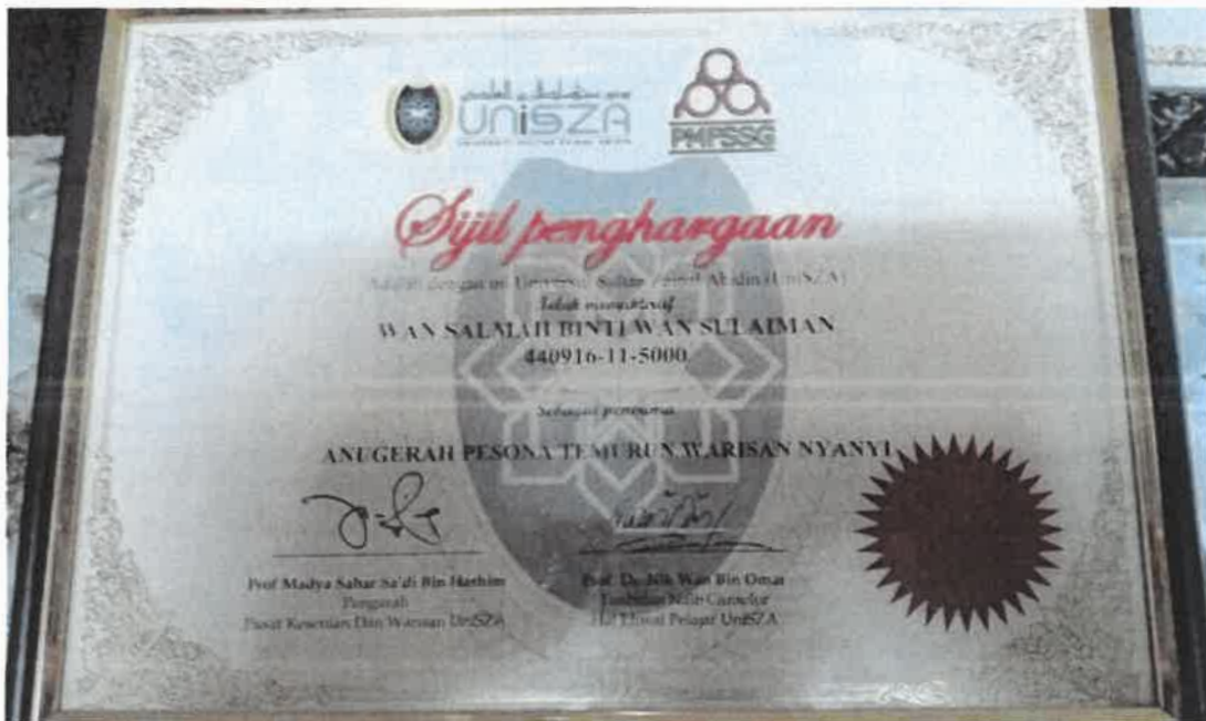
Rajah 8 Sijil penghargaan yang diberikan oleh pihak UniSZA kepada tokoh