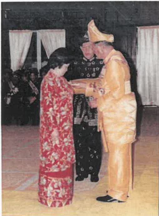
Rajah 6 Tokoh sedang menerima pingat kebesaran