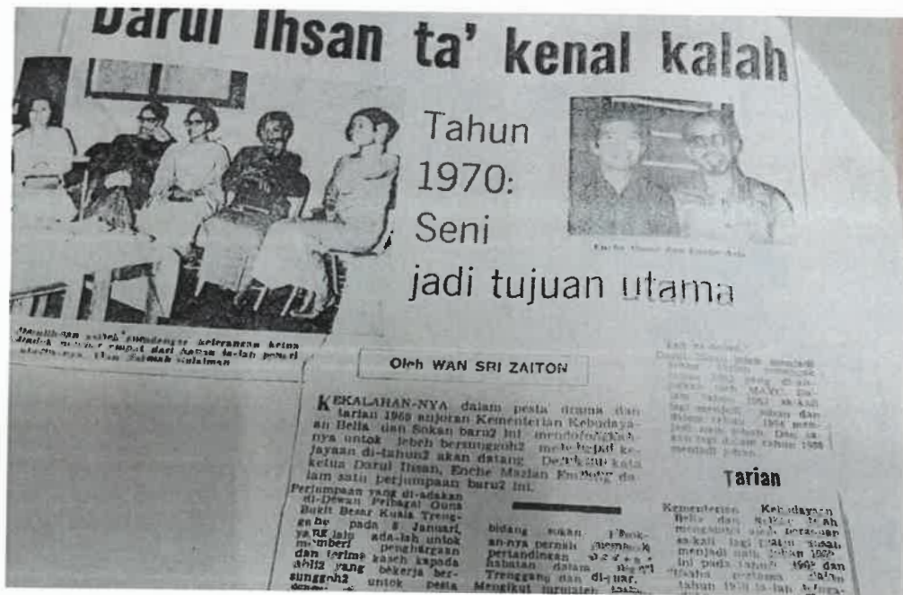
Rajah 10 Antara keratan akhbar mengenai tokoh