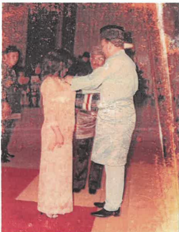
Rajah 4 Tokoh sedang menerima pingat kebesaran