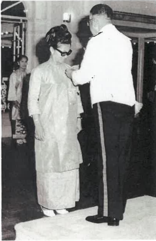
Rajah 5 Tokoh sedang menerima pingat kebesaran