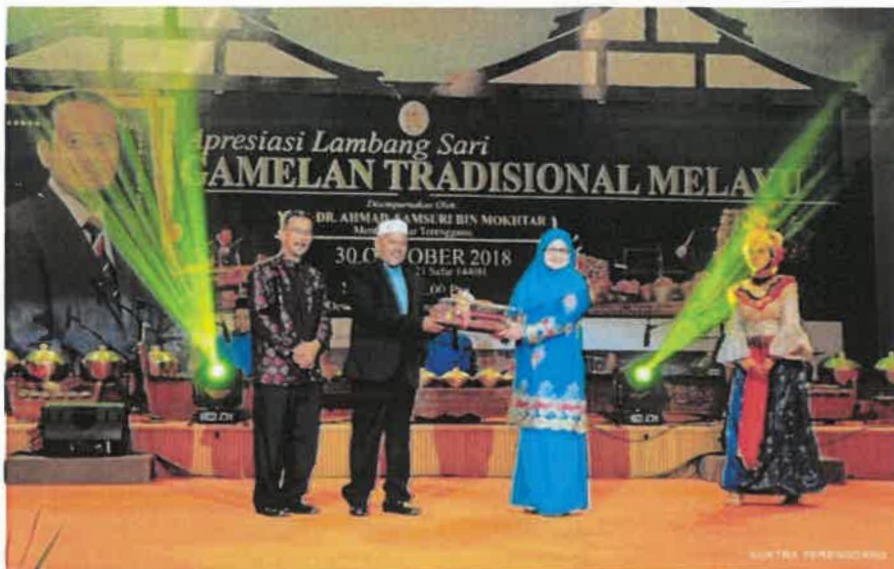
Rajah 3 Menunjukkan tokoh sedang menerima anugerah