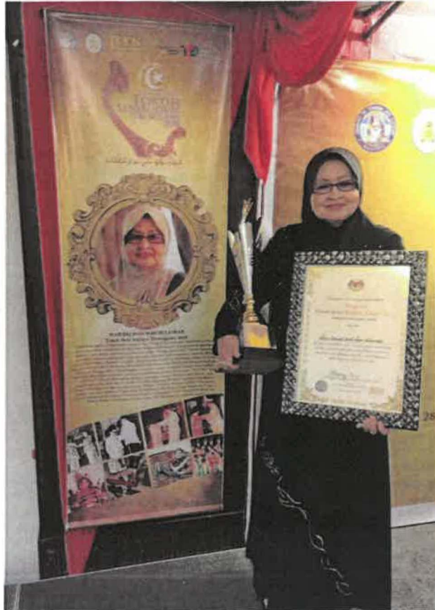
Rajah 1 Tokoh mendapat Anugerah Tokoh Seni Budaya Negeri Terengganu pada 2016