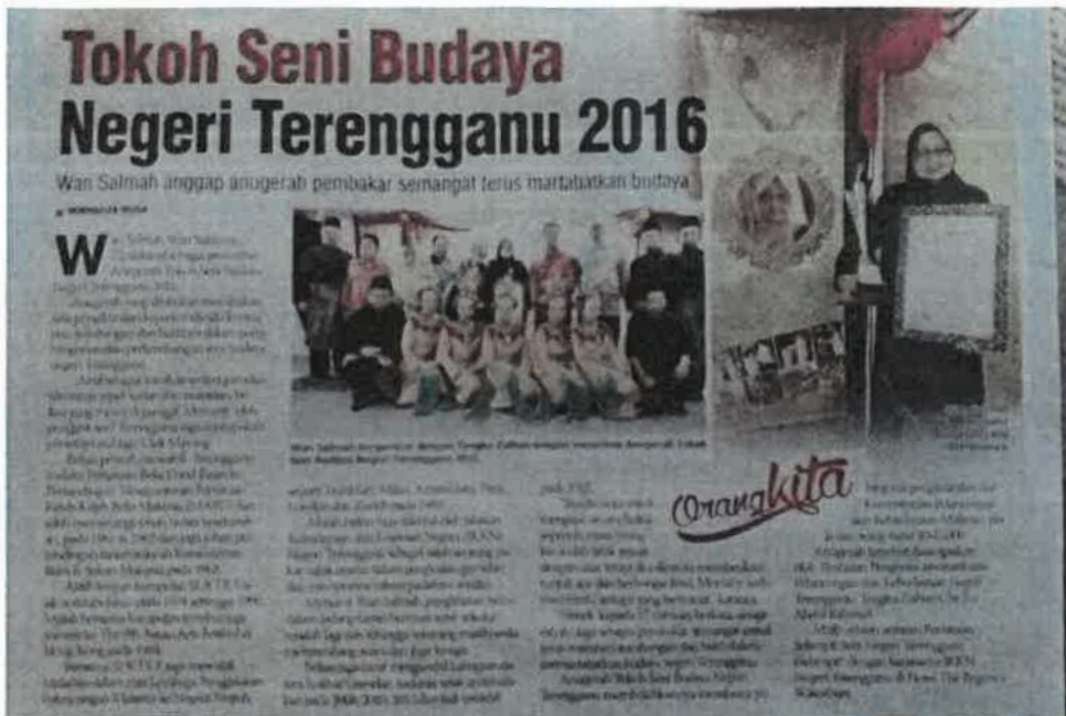
Rajah 7 Antara keratan akhbar mengenai tokoh