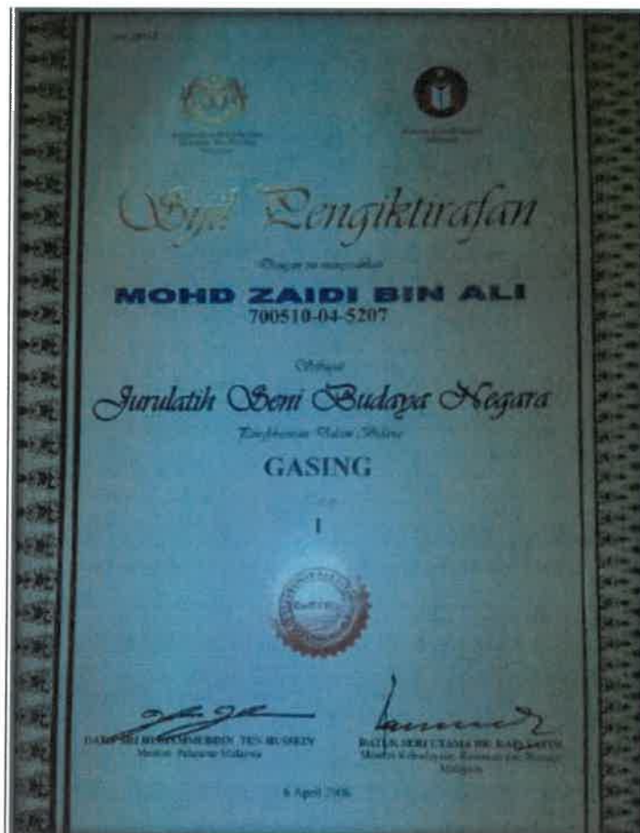
Gambar 2: Sijil pengiktirafan sebagai jurulatih tahap 1