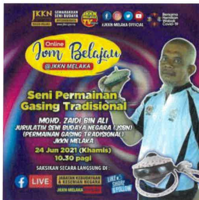
Gambar 7: Poster tokoh semasa menjadi jurulatih dalam talian bagi penonton di sosial media Jabatan Kebudayaan dan Kesenian Negara