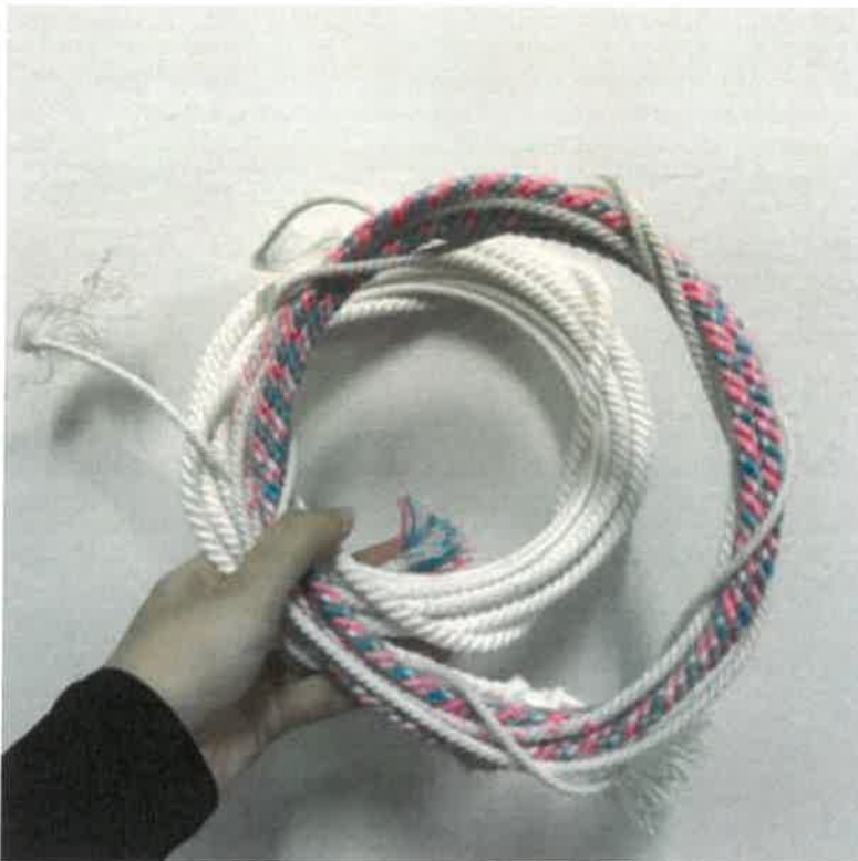
Gambar 15: Tali khas yang ditempah bagi permainan gasing