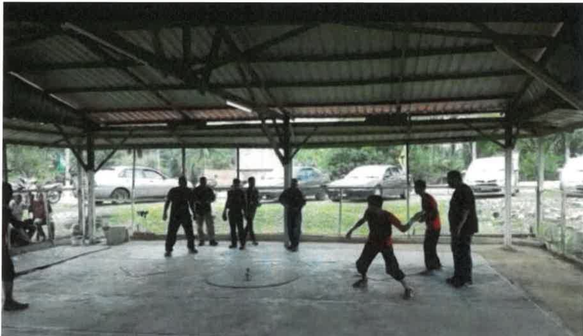
Gambar 9: Anak-anak didik tokoh semasa perlawanan