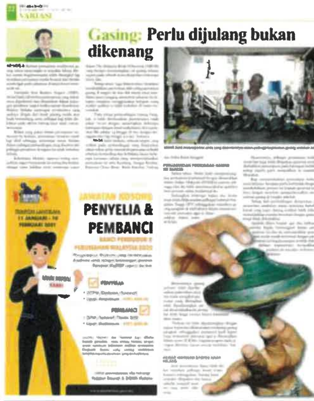
Gambar 6: Keratan akhbar yang menceritakan tokoh