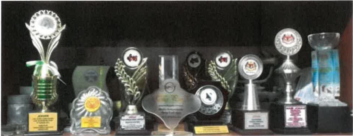
Gambar 10: Antara koleksi-koleksi piala hasil daripada pencapaian beliau