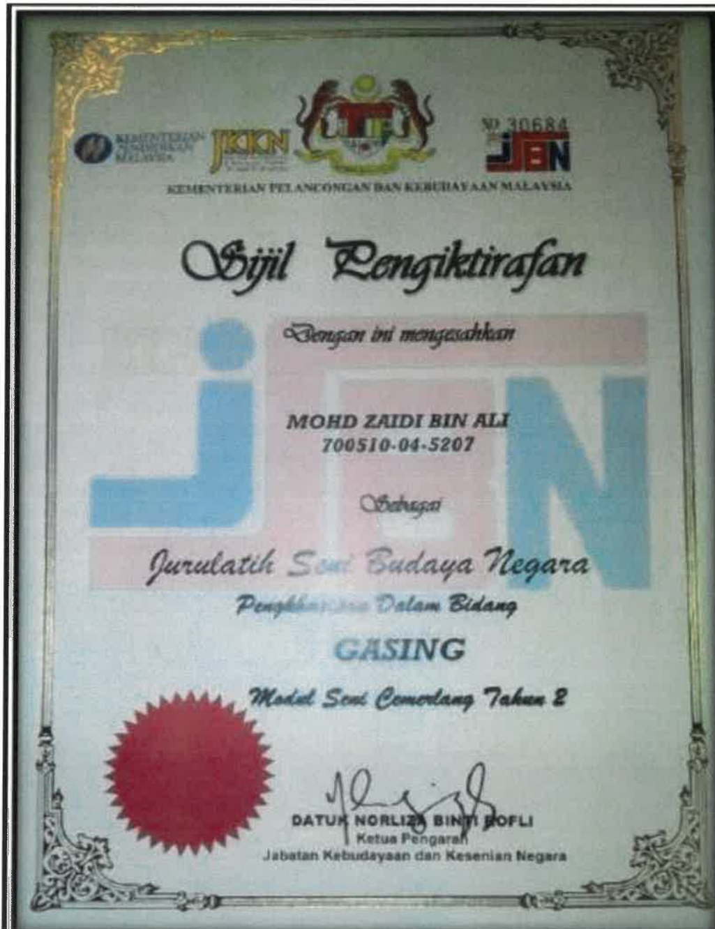
Gambar 5: Sijil pengiktirafan sebagai jurulatih seni budaya negara pengkhususan dalam bidang gasing