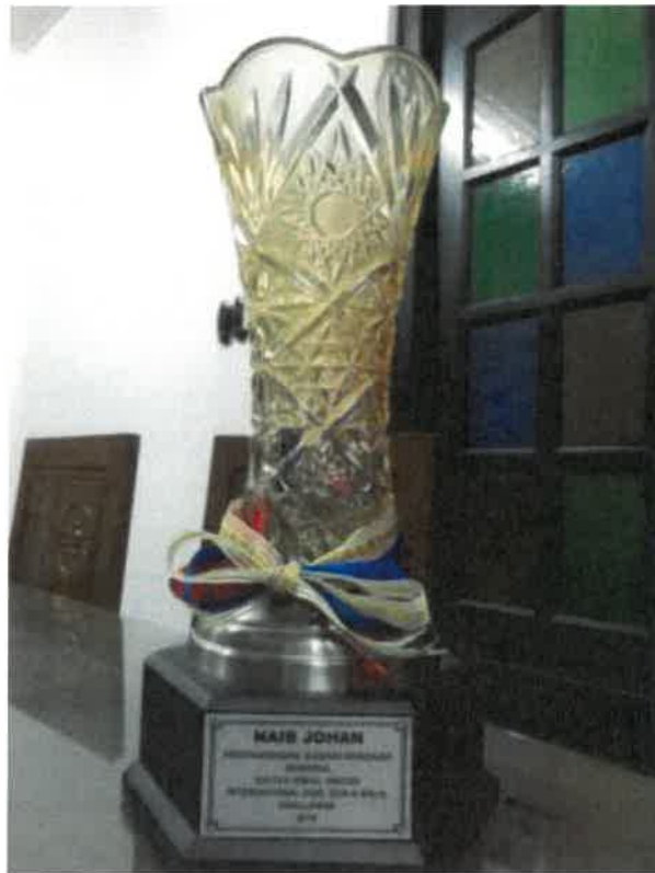
Gambar 11: Piala kemenangan tokoh