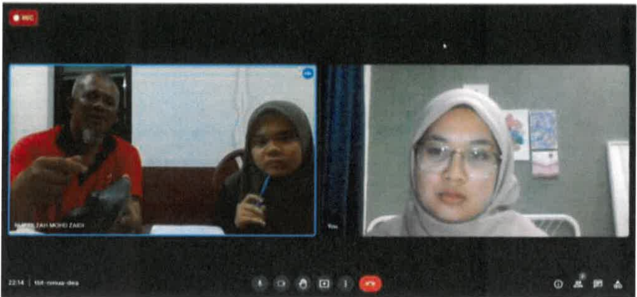
Gambar 1: Sesi temu bual bersama tokoh di Google Meet