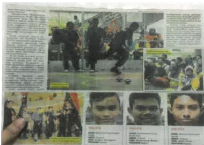
Gambar 13: Keratan akhbar berkaitan anak didik tokoh