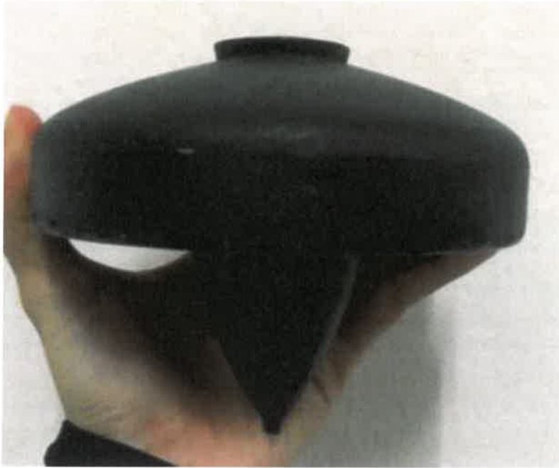
Gambar 14: Satu daripada hasil pembuatan gasing tokoh