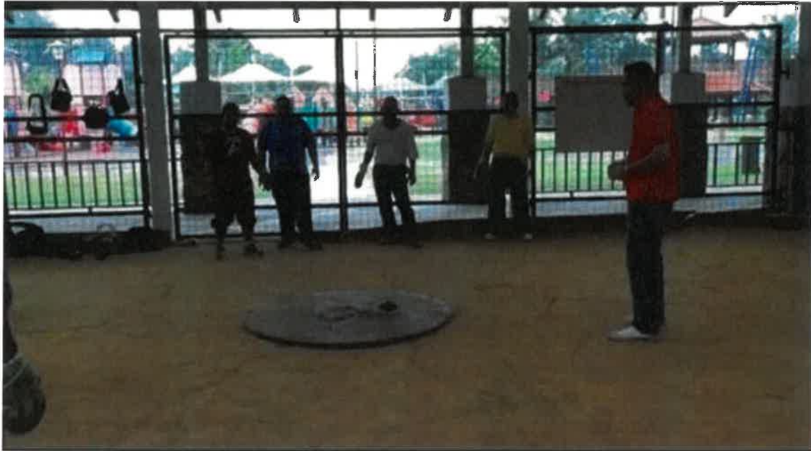
Gambar 8: Tokoh bersama ahli pasukannya