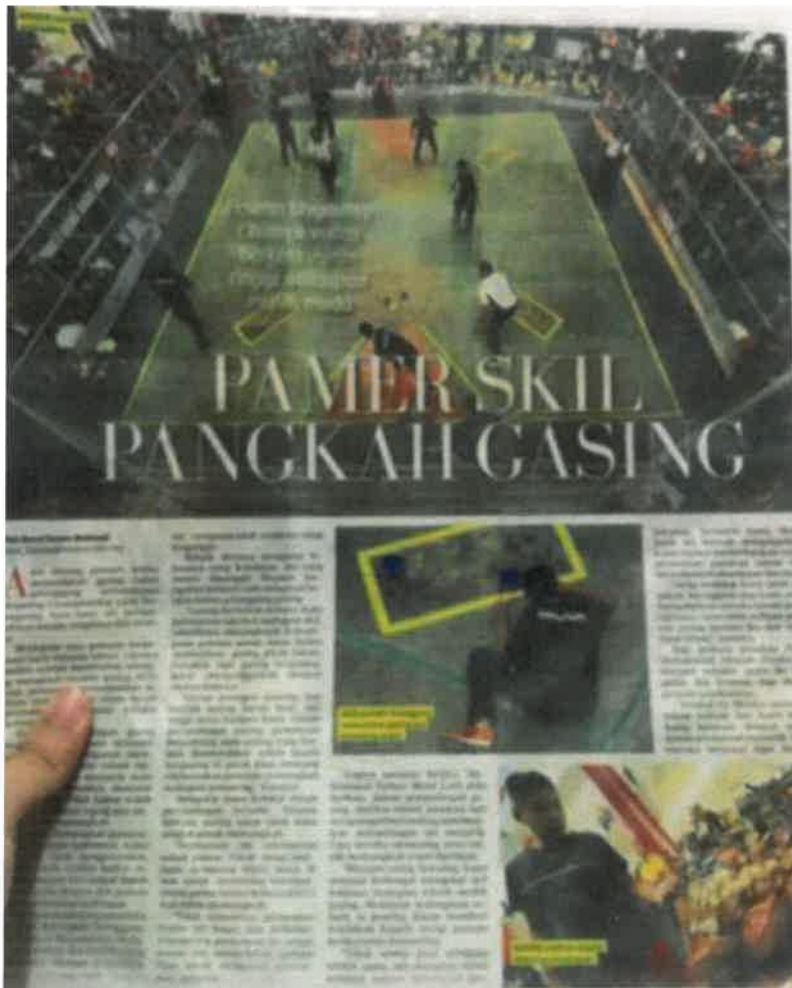
Gambar 12: Keratan akhbar berkaitan tokoh