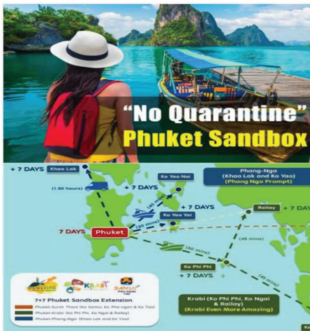
Program Phuket sand box 7+7

Pada 17 Ogos 2021, Tourism Authority of Thailand (TAT) telah menaiktaraf program Phuket sandbox 7+7 dengan menambah lebih banyak destinasi pelancongan iaitu Pulau Krabi, Phang-Nga dan Surat Thani. Program Phuket sandbox 7+7 membolehkan pelancong menetap di Pulau Phuket selama tujuh hari pertama dan melakukan perjalanan ke wilayah lain (Pulau Krabi, Phang-Nga dan Surat Thani) tanpa perlu kuarantin dalam tempoh tersebut