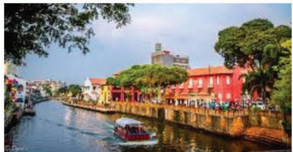
River cruise, Melaka

Pelan pemulihan sektor pelancongan perlulah disertai dengan pelbagai strategi yang berkesan dan mampu meyakinkan agar rancangan berjaya dilaksanakan dalam tempoh tertentu. Perubahan dan kemampuan dalam meneruskan kelangsungan perniagaan terutamanya di dalam sektor pelancongan amatlah mencabar dan berisiko. Akan tetapi, dalam rancangan pemulihan ini perkara utama yang perlu dititikberatkan termasuklah langkah-langkah tindak balas yang bersepadu untuk mengekalkan kapasiti di sektor ini pada paras selamat dan mengatasi jurang risiko dengan memperkukuhkan kerjasama negara-negara antarabangsa dan platform pembangunan pelancongan yang lebih berdaya tahan dan lestari. Walaupun penyelesaian dasar yang fleksibel diperlukan untuk memungkinkan ekonomi sektor pelancongan hidup bersama virus dalam jangka masa pendek atau panjang, ia penting untuk melihat skop yang lebih luas dan mengambil langkah untuk belajar dari krisis ini dengan mengadakan pelan tindakan risiko yang teratur dan efektif. Disamping itu, dengan implikasi krisis pandemik Covid-19 ini kerajaan dan agensi swasta perlulah memanfaatkan kaedah digitalisasi serta mempromosikan transformasi struktur yang diperlukan untuk membangun ekonomi pelancongan yang lebih kuat, lebih lestari dan berdaya tahan.