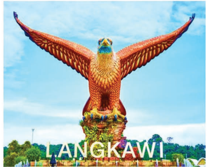
Program Rintis Langkawi

Buat masa ini, pelancong domestik berpeluang melancong menerusi projek Gelembung Pelancongan Langkawi, dan juga dibenarkan untuk aktiviti pelancongan Intra-State (dalam negeri yang sama) bagi negeri-negeri yang berada dalam Fasa 2 dan ke atas berdasarkan Pelan Pemulihan Negara (PPN). Sehingga kini Malaysia masih menutup sempadan antarabangsa kepada pelancong dan pelawat antarabangsa kecuali bagi mereka yang berkeperluan seperti pelajar antarabangsa, kakitangan pejabat kedutaan, urusan rasmi perniagaan dan lain-lain.