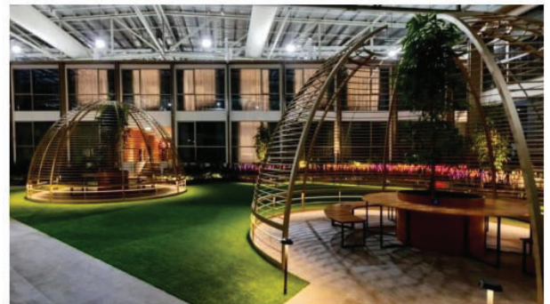
Fasiliti Connect@Changi Pelancong Perniagaan

Singapura pada kadar yang cepat setelah kekangan pandemik Covid-19. Usaha Singapura tersebut dijangkakan dapat mempertingkatkan pemulihan sektor acara MICE (Meetings, Incentive Travel, Conventions & Exhibitions) dan hospitaliti serta dapat berfungsi dengan baik sebagai hub perniagaan global. Bagaimanapun, kini usaha tersebut ditangguhkan pada suatu ketetapan lain akibat penularan Covid-19 di Singapura. Terjejas sama adalah usahasama kerajaan Singapura dan Hongkong untuk melaksanakan Quarantine-Free Travel Bubble pada May 2021 yang lalu juga terpaksa ditangguhkan akibat penularan Covid-19 di Singapura.