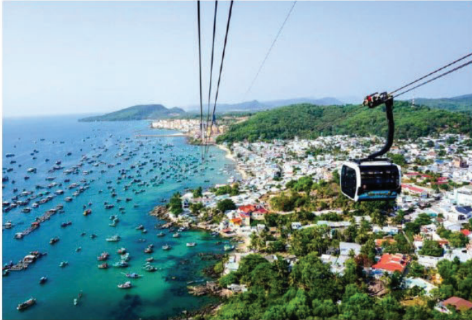
Destinasi Perlancongan Phu Quoc

Merujuk kepada dasar Politburo, Kementerian Kebudayaan, Sukan dan Pelancongan Vietnam atau “National Administration of Tourism” (VNAT) dipertanggungjawabkan dalam pelan pemulihan ini bagi melaksana rancangan perintis untuk membuka semula sektor pelancongan antarabangsa ke Phu Quoc sekaligus menarik lebih 2 hingga 3 juta kemasukan pelancong ke pulau itu pada akhir tahun 2021 sebagai daya tarikan utama Vietnam. Sehubungan dengan itu, kerjasama unit-unit di bawah Kementerian Kesihatan dan Kementerian Maklumat & Komunikasi untuk bergabung tenaga bagi membangunkan dan memperkenalkan aplikasi “Vietnam Safe Travel” yang menggabungkan aplikasi “Deklarasi Kesihatan” menurut peraturan Kementerian Kesihatan. Aplikasi ini menjadi kunci utama pelancong keluar dan masuk ke Vietnam. Aplikasi ini juga ditingkatkan dan menggabungkan lebih banyak kemudahan lain termasuk deklarasi keselamatan COVID-19 untuk tempat perniagaan pelancongan, peta digital perjalanan yang selamat, dan kemudahan bersepadu seperti penjejakan rekod kesihatan, insurans perjalanan, e-tiket, perkhidmatan tempahan dan pencarian tempat-tempat menarik.