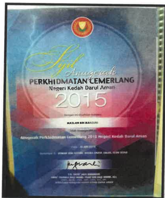
Rajah 1: Sijil Anugerah Perkhidmatan Cemerlang