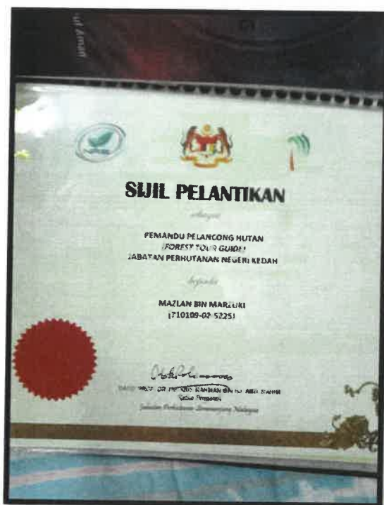
Rajah 2: Sijil Pelantikan sebagai Pemandu Pelancong Hutan