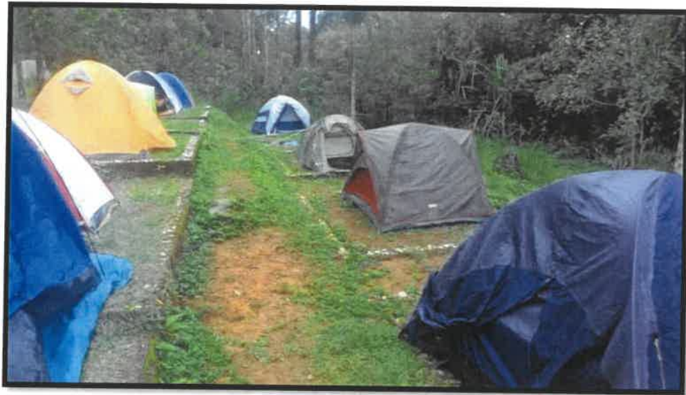
Rajah 8 Aktiviti-aktiviti yang dijalankan oleh Encik Mazlan bersama pengunjung