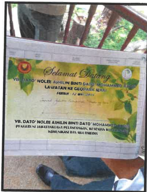
Rajah 6 Lawatan Pengerusi Jawatankuasa Pelancongan, Kesenian Kebudayaan , Komunikasi dan Multimedia ke Geopark Jerai