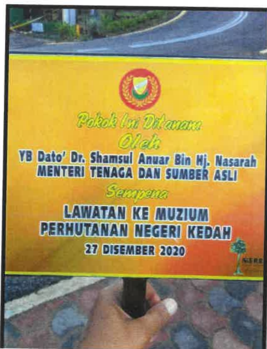
Rajah 5 Papan Penghargaan atas Lawatan ke Muzium Perhutanan Negeri Kedah