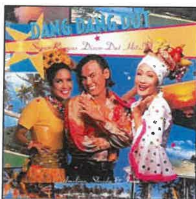
Rajah 5: Album Dang Dang Dut