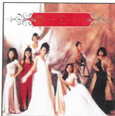
Rajah 3: Album Puteri Dangdut