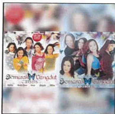
Rajah 4: Album Semarak Dangdut