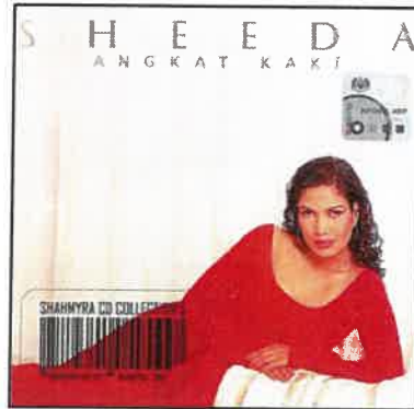
Rajah 1: Album pertama Angkat Kaki