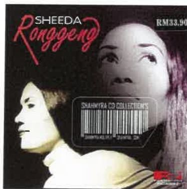
Rajah 2: Album kedua Ronggeng