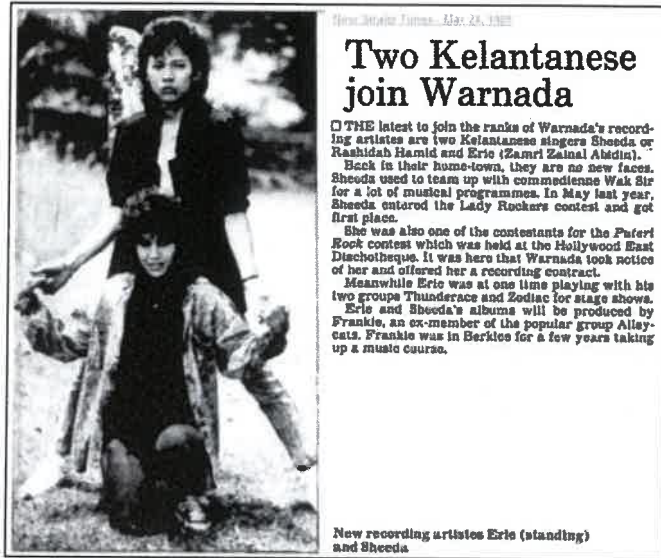
Rajah 7: Keratan Akhbar Tokoh Pertama Kali Menjadi Recording Artist