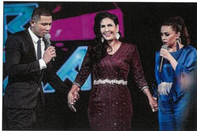
Rajah 8: Tokoh di Pentas Gegar Vaganza