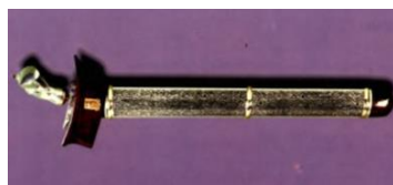
Keris Sempana Alam Buana

Keris Sempana Alam Buana telah ditukar nama kepada Cokmar/Keris Agung bermula Istiadat Konvokesyen UiTM tahun 2000.