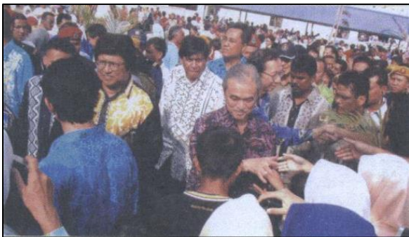
Ketibaan Perdana Menteri disambut meriah oleh para hadirin

UiTM Pulau Pinang mula beroperasi pada 16 Jun 1996 di kampus semmentaranya di Permatang Pasir dengan enrolmen pelajar pertama seramai 230 orang. Mereka telah pun menamatkan pengajian pada Mei 1999. Program-program yang ditawarkan di UiTM Pulau Pinang adalah Kejuruteraan Elektrik, Mekanikal dan Awam di peringkat diploma. Program lain yang turut ditawarkan ialah program Pengurusan Hotel dan Pelancongan. Kampus baru ini berupaya menempatkan 10,000 orang pelajar.