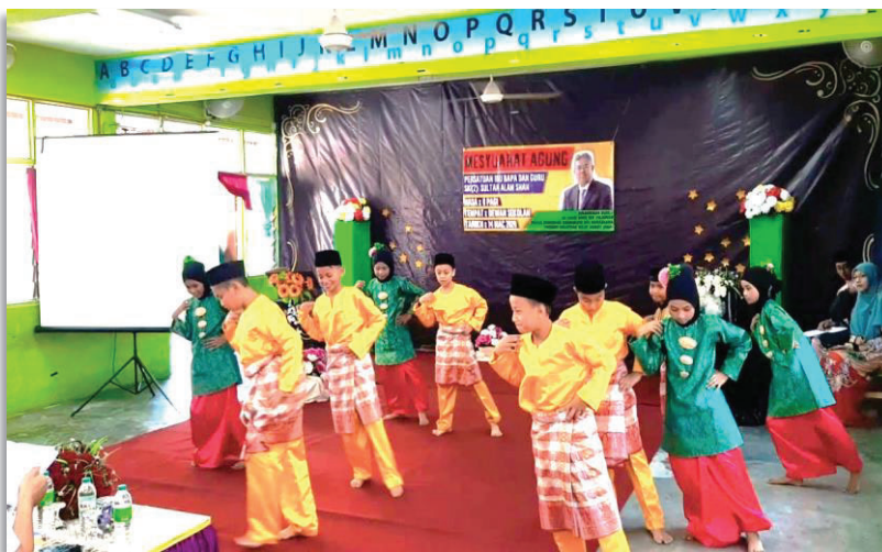
Gambar 2. Tarian tradisional diajar di peringkat sekolah memberikan pendedahan awal kepada pelajar demi memupuk minat generasi muda.

Oleh itu guru memainkan peranan yang penting dalam pembentukan generasi negara yang berilmu. Peranan guru hari ini tidak lagi sama dengan peranan guru pada masa lalu. Yang pasti, guru akan terus berhadapan dengan pelbagai cabaran pada masa akan datang.