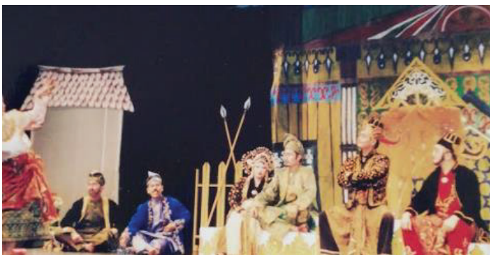
Gambar 1. Kesenian tradisional boleh disampaikan kepada pelajar sekolah melalui latihan dalam aktiviti kokurikulum.

Berdasarkan beberapa tapisan tertentu, guru harus mempunyai kemahiran tertentu untuk diaplikasikan dalam profesion mereka. Sebagai contoh, seorang guru yang mempunyai kemahiran dalam bidang tarian, drama, teater, nyanyian, boleh pula bermain alat muzik mempunyai satu kelebihan yang boleh digunakan untuk mengajar pelajar khususnya melalui kokurikulum. Semua kemahiran yang dimiliki oleh seseorang guru ini akan diaplikasikan semasa sekolah mengadakan Hari Anugerah Cemerlang, Hari Guru, Hari Sukan, Hari Kantin atau Hari Karnival. Guru akan bertindak sebagai jurulatih dan pembimbing. Kesudian dan kerjasama guru dalam menjalankan tugas sedemikian serta kesanggupan mereka mengorbankan masa yang lebih banyak membuktikan pengorbanan guru yang amat besar.