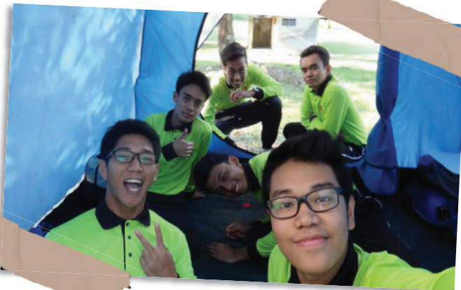
Gambar 3. Merakam kenangan bersama rakan-rakan kursus Kesatria Negara Tahap 2 sewaktu menyertai aktiviti Tempur Tanpa Senjata