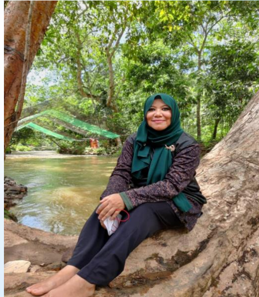
Penulis di sungai Kuala Kedua, Baling

Jika berkelana ke Kuala Perlis Jangan dilupa buah berangan Alhamdulillah, diizinkan menulis Terhasillah pantun buat kenangan