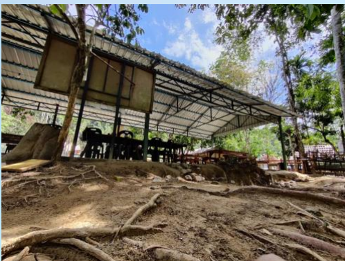
Pengunjung boleh menjamu selera di kedai berdekatan