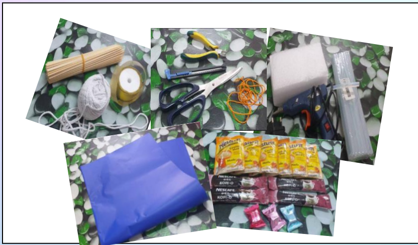
Rajah 1: Bahan yang diperlukan

Langkah 1: Sediakan bahan-bahan yang diperlukan seperti gam tembak, pita selofan, gunting, kertas pembalut, lidi pelbagai saiz (lidi cucuk satay pun boleh), getah/tali, span bunga, riben serta bahan-bahan utama yang diperlukan iaitu bunga hiasan, coklat atau wang kertas seperti yang telah ditunjukkan di dalam Rajah 1.