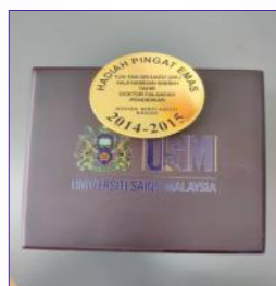
Hadiah Pingat Emas untuk Doktor Falsafah Pendidikan 2014-2015 oleh USM yang dianugerahkan kepada penulis

Saya tidak banyak pengalaman lain. Saya juga tidak punya banyak artikel yang diterbitkan di jurnal-jurnal tersohor. Namun ini ialah nasihat yang saya kongsi dari hati dan pengalaman. Dan yang lebih istimewa, ianya terhasil daripada usaha saya berguru dengan rakan yang tidak kedekut ilmunya. Moga perkongsian beliau dianugerahkan sebaik-baik pahala oleh Al-Hadi iaitu Allah Yang Maha Pemberi Petunjuk.