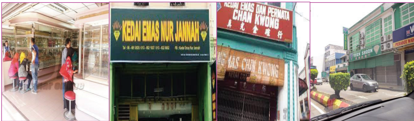
Kedai- kedai Emas di sekitar Kuala Pilah.