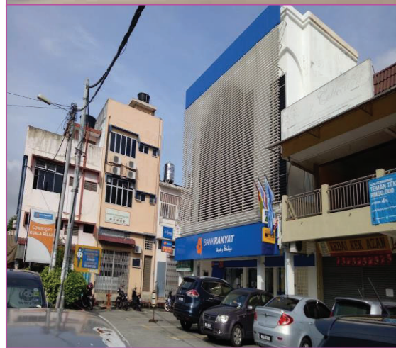
Gambar menunjukkan AgroBank Kuala Pilah (atas) dan Bank Rakyat Kuala Pilah.