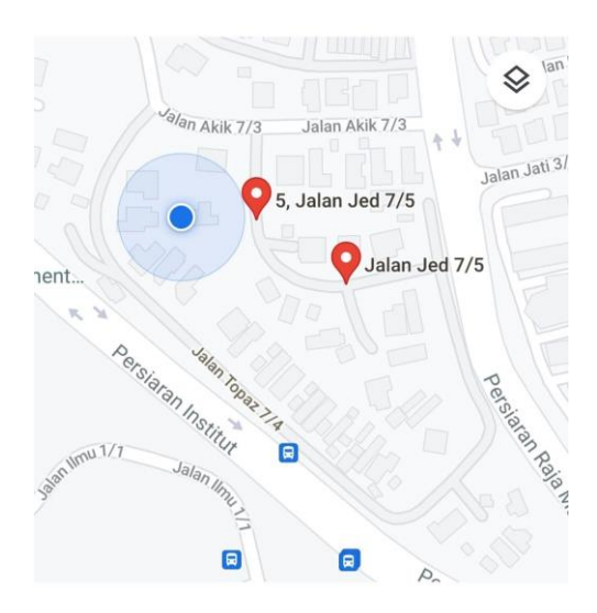
Eco-Khan Palace was located at <u>No.5</u>, Jalan Jed 7/5, Seksyen 7, Shah Alam, 40000, <u>Selangor.</u>

The name of "Eco-Khan Palace" was the combination of the words "Ecosystem", "Farkhan", and "Palace". The purpose of why I choose that combination of words is because is suits so much with my one of the primary goals, which is enhancing and promoting the beauty and value of nature by providing my customers a highquality plant. In fact, using my name into company name make it looks authentic and human identities.