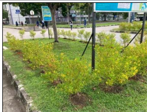
Transformasi projek taman mini APB Greenation