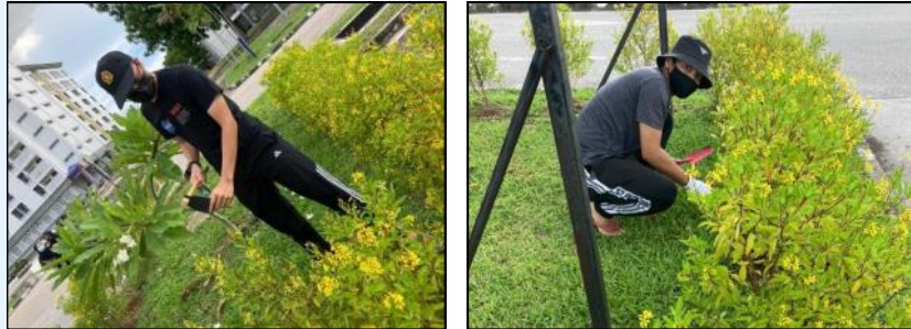
Pelajar membantu merumput dan menggemburkan tanah

Semenjak pelaksanaan Perintah Kawalan Pergerakan, aktiviti menjaga pokok-pokok yang ditanam pasti menjadi sukar kerana hampir kesemua staf perlu bekerja dari rumah (BDR). APB tetap mengambil inisiatif sendiri untuk terus memantau dan memastikan pokok-pokok yang ditanam berada dalam keadaan baik. Beberapa usaha memangkas batang kering, menggembur tanah, merumput dan membaja pokok telah dijalankan secara berkala sewaktu PKP dengan penglibatan staf yang minima. Sewaktu awal PKP, APB amat berterima kasih kepada beberapa orang pelajar yang turut membantu dalam usaha ini.