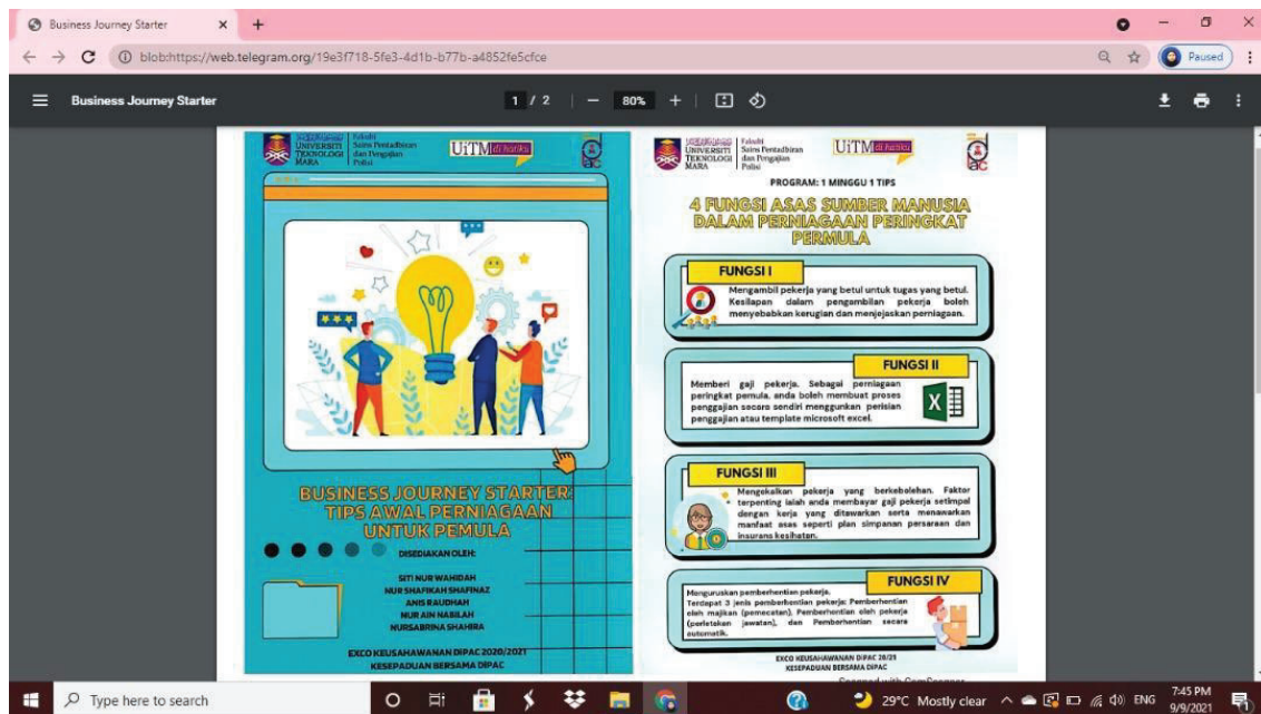
3.1. Gambar Rajah 1

Di samping itu, buku digital ini dapat digunakan dan diperolehi melalui pengimbasan QR kod. QR kod merupakan kod yang boleh dibaca mesin yang terdiri daripada pelbagai kotak hitam dan putih, yang biasanya digunakan untuk menyimpan URL atau maklumat lain untuk dibaca oleh kamera pada telefon pintar. (QR Code, 2013) Oleh itu, pengguna yang ingin menggunakan buku digital ini dapat menggunakannya dengan hanya mengimbas QR kod yang diberi melalui telefon pintar. Tambahan pula, penggunaan QR kod ini sangat mudah dan cepat untuk digunakan oleh semua orang pada bila-bila masa tanpa sebarang halangan. Selain daripada itu, buku digital ini juga mempunyai pelbagai corak yang dapat menarik minat penggunanya apabila membaca. Hal ini kerana ianya penuh dengan isi-isi penting yang ringkas, padat dan mudah difahami tanpa ayat-ayat yang panjang yang kompleks. Sebagai contoh, gambar rajah dibawah merupakan antara gambar yang diambil hasil daripada penciptaan buku digital kami ini.