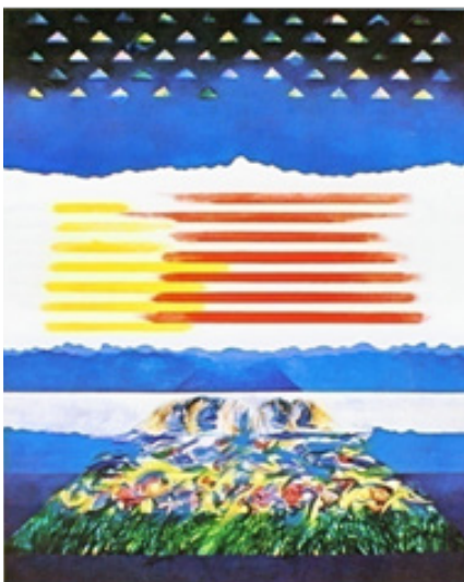
Gambar: Syed Ahmad Jamal, “Tun Mamat Mendaki Himalaya” (1984), Akrilik atas kanvas, 299 x 168 sm. Koleksi: Bank Negara Malaysia.