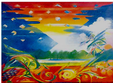
Gambar: Syed Ahmad Jamal, "Sirih Pinang" (1982), Akrilik di atas kanvas, 199 x 199 sm. Koleksi: BSVN.

"Sirih Pinang" (1982) adalah bersandarkan adat dan tradisi dalam konteks budaya Melayu. Umumnya, sirih pinang merupakan sejenis kudapan pembuka bicara dalam urusan resmi adat dan adab Melayu. Daun sirih adalah lambang adat dan simbol dalam seni budaya dan istimewanya digunakan sebagai adat istiadat masyarakat Melayu. Sirih biasanya menjadi lambang atau adat bagi sesuatu majlis, menjadi penyeri wajah atau pengikat kasih dalam upacara-upacara perkahwinan, pertunangan dan sebagainya. Jelasnya, daun sirih memang dipandang sebagai alat budaya yang amat penting khususnya di dalam adat-adat Melayu.