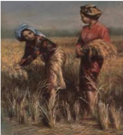
Gambar: Mohd. Hoessein Enas, “ The Harvester ” (1989), Pastel dan arang atas kertas, 58.7 x 47.9 sm. Koleksi: BSVN.