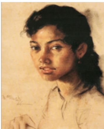
Gambar: Mohd. Hoessein Enas, "Aida" (1966), Pastel atas kertas, 56 x 44 sm, Koleksi BSVN

Catan ini merupakan suatu rakaman tentang budaya Melayu dalam adat memining. Melaluinya diperlihatkan tentang adat memining yang masih mengekalkan tradisi lama (Siti Rohayah Atan, 1998). Karya "Meminang" (1964) menjelaskan tentang pengekaln tradisi lama tentang adat peminangan dengan ketertibannya. Objek atau alat budaya benda ( material ) seperti tepak sirih atau sirih junjung mempunyai tempat yang mulia dan istimewa dalam budaya Melayu (Syed Ahmad Jamal, 1992). Ia alat bagi tujuan menjunjung adat yang kaya dengan nilai dan falsafahnya tersendiri yang masih menjadi amalan bagi kebanyakan orang Melayu pada hari ini. Setiap kali berhadapan dengan karya-karya Mohd. Hoessein Enas, pengkritik pasti menjelaskan tentang apa yang dilukis bukan sekadar