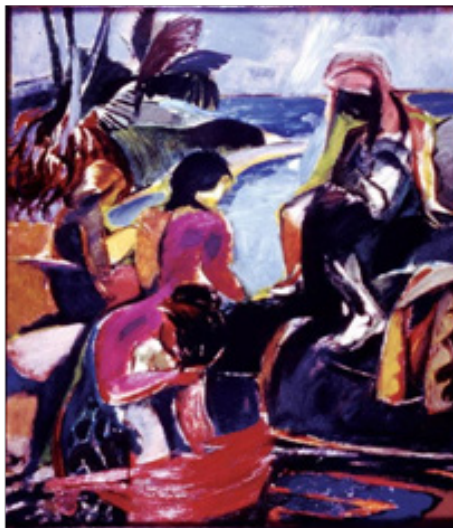
Gambar: Syed Ahmad Jamal, “Mandi Laut” (1957), Cat minyak atas papan, 112 x 87 sm. Koleksi: BSVN.

Wujud suatu kecenderungan terhadap penggunaan aspek simbol, bentuk dan warna yang membentuk trend atau identiti dalam catan-catan Syed Ahmad Jamal iaitu bermula dari tahun 1970-an lagi. Terkesan daripada Gagasan Kebudayaan Kebangsaan tahun 1971 yang mengariskan beberapa unsur untuk dijadikan landasan terbaik pengkaryaan. Gagasan tersebut meletakkan kebudayaan rakyat asal rantau ini sebagai pencetus atau teras terhadap penciptaan seni. Sementara itu, Islam sebagai tunjang atau paksi kepada penghayatan seni dilihat sebagai suatu tanggungjawaban yang perlu diisi. Meskipun Syed Ahmad Jamal merupakan pelopor pemikiran aliran seni baharu yang didatangi dari Barat di Malaysia, namun beliau sama sekali tidak meminggirkan pertalian antara ikatan seni dan budaya tanah air sebaliknya wujud penerapan konsep serta penggabungan pengaruh alam Melayu Nusantara yang mempunyai keperibadian tersendiri seperti yang termaktub dalam dasar kebudayaan kebangsaan. Hasilnya terciptalah karya-karya seni Syed Ahmad Jamal yang bersirikan “Gunung Ledang”, berunsurkan motif tradisi dengan penggunaan simbol segi tiga atau “tumpal” serta pengadunan seni khat dengan ciri-ciri keislaman.