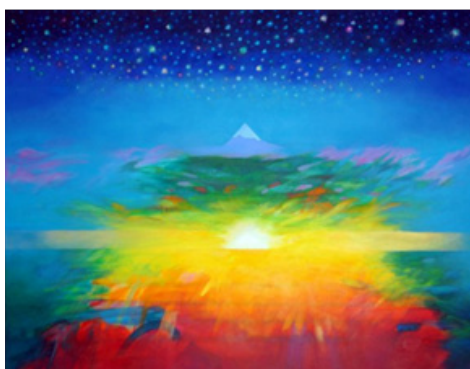
Gambar: Syed Ahmad Jamal, "Semangat Ledang" (2003), Akrilik pada kanvas, 203 x 274.5 sm. Koleksi: Balai Seni Visual Negara.

"Sirih Pinang" (1982) adalah bersandarkan adat dan tradisi dalam konteks budaya Melayu. Umumnya, sirih pinang merupakan sejenis kudapan pembuka bicara dalam urusan resmi adat dan adab Melayu. Daun sirih adalah lambang adat dan simbol dalam seni budaya dan istimewanya digunakan sebagai adat istiadat masyarakat Melayu. Sirih biasanya menjadi lambang atau adat bagi sesuatu majlis, menjadi penyeri wajah atau pengikat kasih dalam upacara-upacara perkahwinan, pertunangan dan sebagainya. Jelasnya, daun sirih memang dipandang sebagai alat budaya yang amat penting khususnya di dalam adat-adat Melayu.