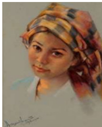
Gambar: Mohd. Hoessein Enas, "Peasant Girl" (1993), Pastel atas kertas, 48 x 32 sm, Koleksi: Penang Art Gallery.