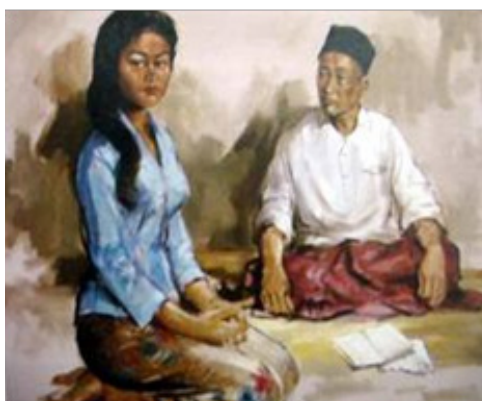
Gambar: Mohd. Hoessein Enas, "Admonition" (1959), Cat minyak atas kanvas, 111 x 90 sm. Koleksi: Tenaga Nasional Berhad.

rupa tetapi adalah gambaran sebenar wajah dan watak yang tersirat di sebalik imej itu. Jika diperhalusi, di sebalik keaslian kejelitaan gadis Melayu tercerminnya sifat kelemah-lembutan dan kesantunan budi yang diadun menerusi raut wajah, pakaian dan posisi. Seorang gadis Melayu yang cantik, selain memiliki kesantunan verbal, mereka juga harus teliti tentang perlakuan etiket yang dikategorikan sebagai perlakuan yang santun yang merujuk kepada aspek 'budi' seseorang individu. Ketelitian tersebut diungkap melalui pandangan dualisme iaitu dari sudut luaran dan dalaman. Dalam konteks ini, masyarakat Melayu amat menjunjung tinggi seseorang yang memiliki rupa paras baik di samping memiliki sifat yang seimbang dari segi moral dan personalitinya. Menurut Mulyadi Mahamood (1995), pelukis secara jelas memperjuangkan falsafah seni nilai bangsa, justeru menampilkan karya-karya bernafaskan kemelayuan.