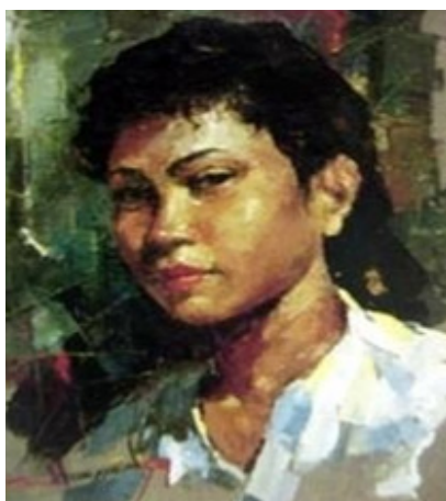
Gambar: Mohd. Hoessein Enas , “Gadis Melayu” (1959), Cat minyak atas kanvas, 55 x 45 sm. Koleksi: BSVN