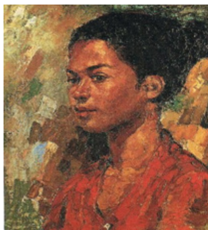
Gambar: Mohd. Hoessein Enas , “Minah” (1958), Cat minyak atas kanvas, 43.5 x 35 sm. Koleksi: BSVN

Meneliti potret “Gadis Melayu” (1959) oleh Mohd. Hoessein Enas jelas merakamkan seorang gadis Melayu desa yang mempunyai rupa paras yang asli dan kaya dengan nilai-nilai kesederhanaan (Mulyadi Mahamood, 2001). Ertinya pengkritik menjelajahi lebih jauh untuk merakam perwatakan yang santun, sopan atau berbudi bahasa yakni melebihi aspek luaran. Dalam konteks budaya Melayu, golongan gadis mahupun wanita adalah dikenali sebagai kelompok yang berbudi bahasa, bersopan santun dan berhemah tinggi (Kamariah Kamarudin, 2006). Perkara ini penting kerana di dalam penghidupan orang Melayu, nilai seseorang itu adalah ditentukan oleh perilakunya. Semakin tinggi ia memegang kesantunan, semakin tinggi pula harkat, martabat, tuah dan maruahnyanya (Tenas Effendy, 2005). Maka dalam hal ini, masyarakat Melayu amat menjunjung tinggi seseorang yang baik rupa paras di samping memiliki sifat yang seimbang dari segi moral dan personalitinya. Di dalam potret ini, Mohd. Hoessein Enas cuba menimbulkan identiti kebangsaan dengan merakam imej figura tempatan secara natural atau semula jadi.